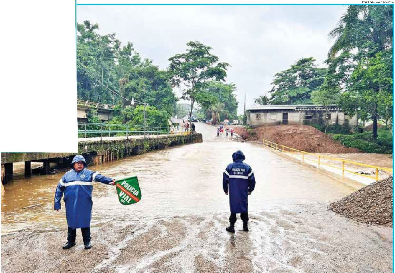
● OAXACA. Diversos caminos de la entidad resultaron seriamente dañados por el aumento del cauce de ríos.