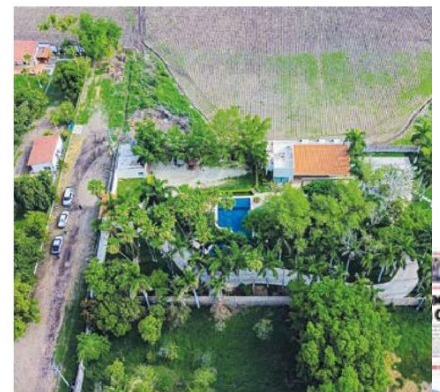
SINALOA. En esta finca fue asesinado Héctor Cuén y secuestrado El Mayo .