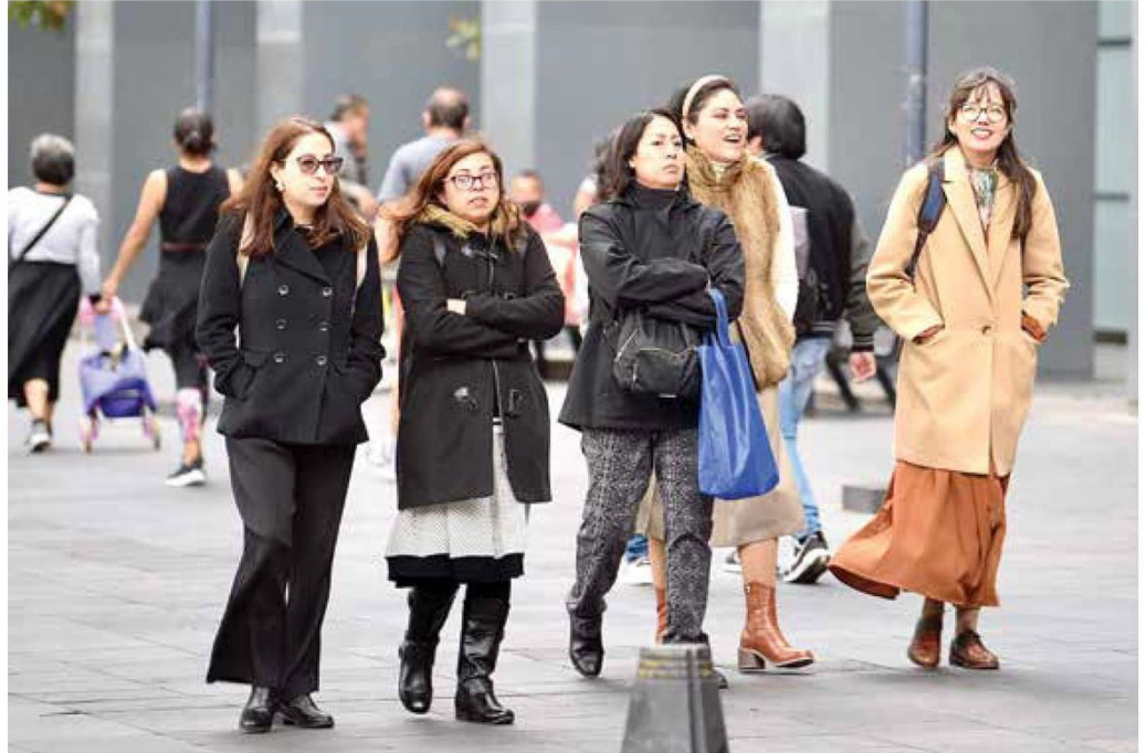
● ABRIGO. La temperatura mínima presentada ayer fue de 6 grados Celsius, a las 5 de la mañana.