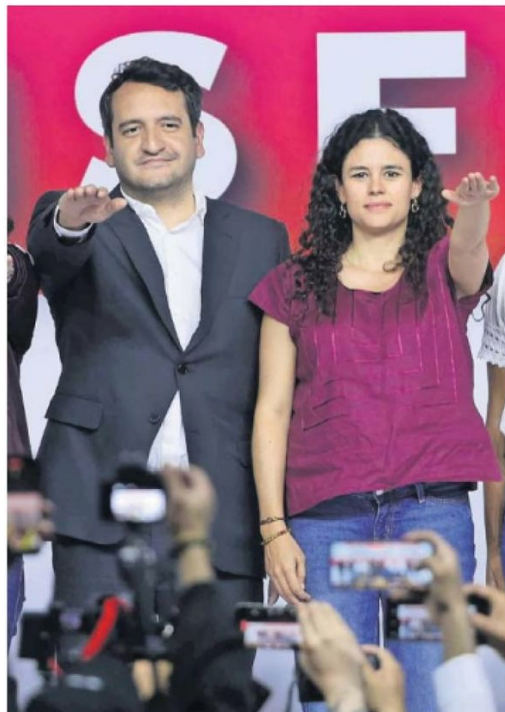
Andrés Manuel López Beltrán y Luisa María Alcalde Luján rindieron protesta ayer a sus nuevos cargos.