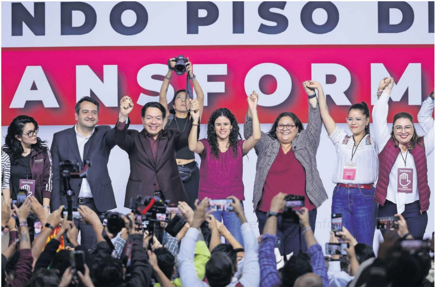
El Congreso Nacional de Morena festejó los nuevos nombramientos que buscan dar continuidad al legado de Andrés Manuel López Obrador.