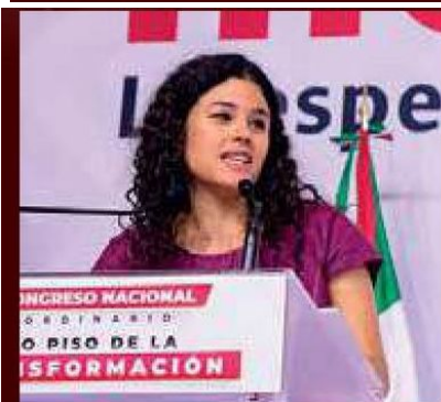
La secretaria de Gobernación dejará su cargo al frente de la dependencia el 30 de septiembre de 2024.

“No voy yo a influir en nada, pero él sí quiere participar en Morena (...) Quiere apostar a ser electo, no impuesto”, dijo López Obrador en una reciente conferencia matutina.