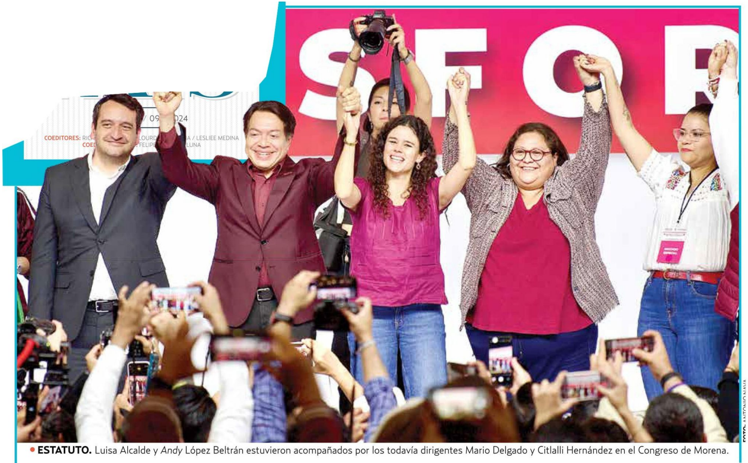
• ESTATUTO. Luisa Alcarde y Andy López Beltrán estuvieron acompañados por los todavía dirigentes Mario Delgado y Citlalli Hernández en el Congreso de Morena.