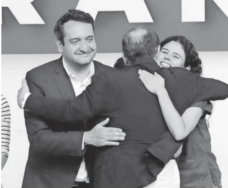
Luisa María Alcalde y Andrés Manuel López Beltrán