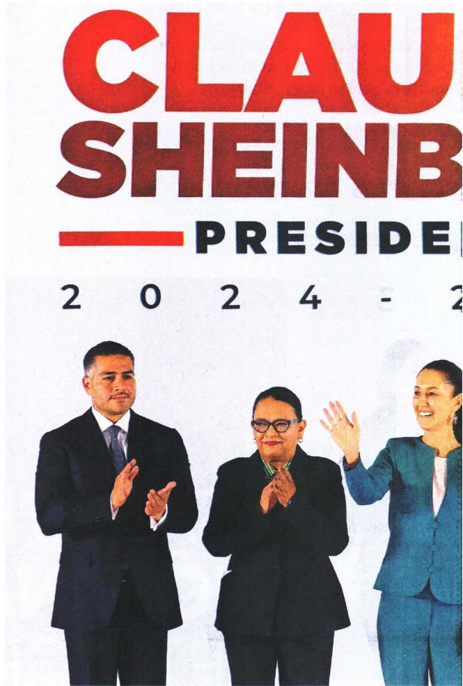
Omar García Harfuch, Rosa Icela Rodríguez, Claudia Sheinbaum Pardo, Ariadna Montiel y Mario Delgado Carrillo, ayer en la presentación de nuevos secretarios.