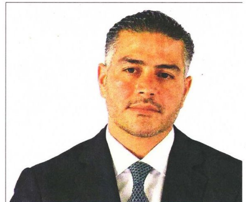
Omar García Harfuch va a la Secretaría de Seguridad y Protección Ciudadana