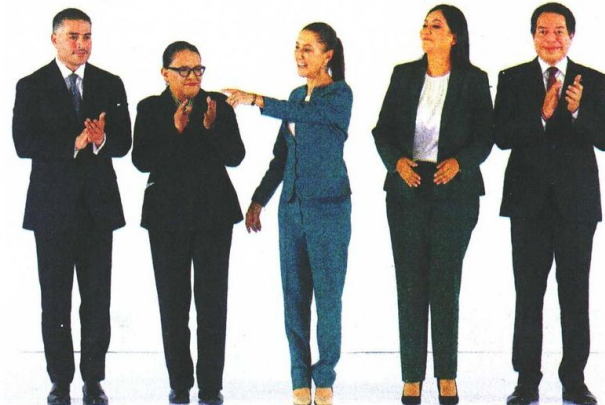
Sheinbaum presentó ayer a Omar García Harfuch, Rosa Icela Rodríguez, Ariadna Montiel y Mario Delgado como parte de su gabinete.