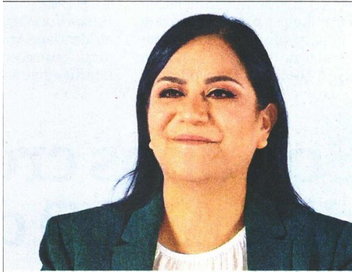
Ariadna Montiel destacó la propuesta de entregar apoyos a mujeres de 60 a 64 años de edad.