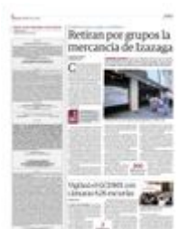
COMERCIANTE saca mercancía de la Plaza Izazaga 89 en un "diablo", ayer.