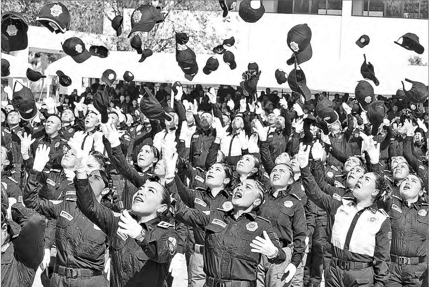
▲ En la ceremonia de graduación, la jefa de Gobierno felicitó a 463 nuevos policías, la mayoría mujeres.

profesionales de seguridad del bien común y ustedes representan eso que la gente quiere: que la policía sirva a la misma población.”