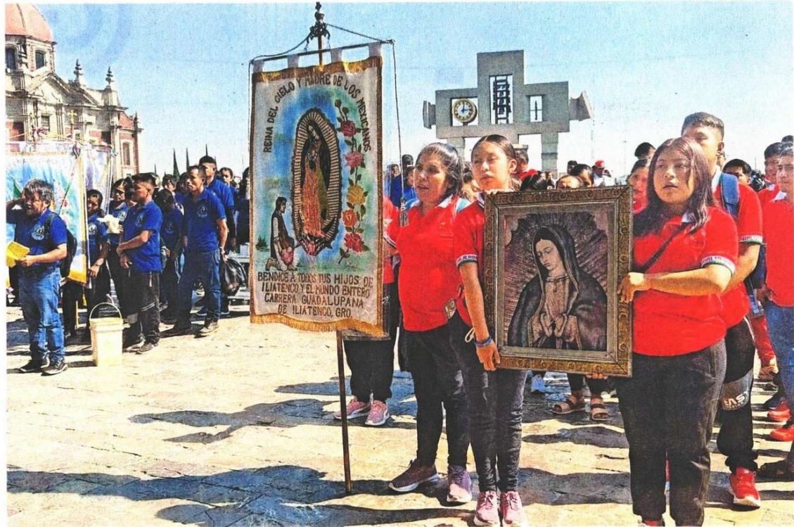
Pese a los altos precios de los productos en los alrededores de La Villa, los peregrinos acuden, como cada año, a manifestar su fe a la Virgen de Guadalupe, a quien le agradecen los favores recibidos y le piden otros.