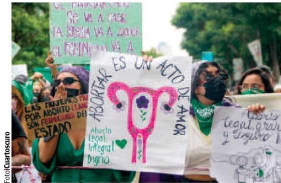
JÓVENES marchan en la capital para exigir el derecho libre a abortar en todo el país, el 28 de septiembre de 2023.

ORGANIZACIONES civiles y feministas preparan una manifestación y un “bailongo” el 28 de septiembre para exigir el aborto legal y gratuito en el país.