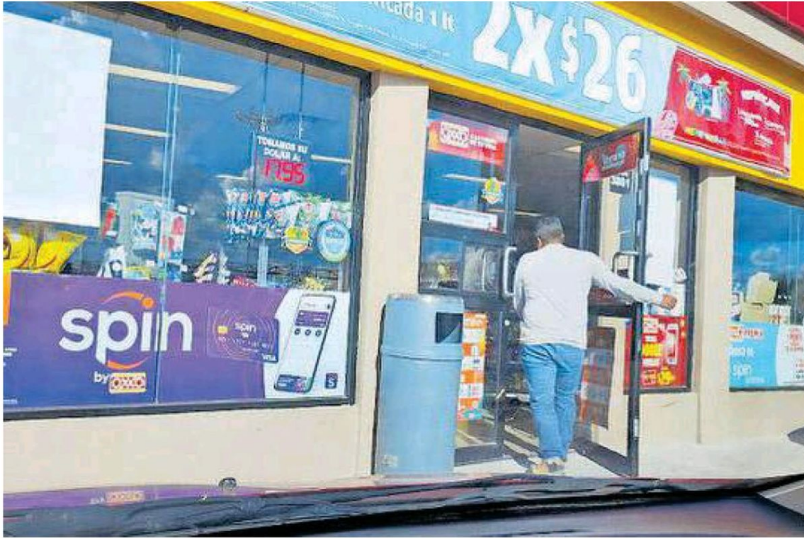
Sucursal de Oxxo en la colonia Los Fresnos, de Nuevo Laredo, Tamaulipas