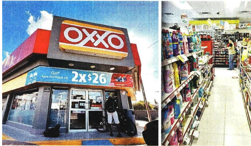
Las tiendas Oxxo del centro de Nuevo Laredo fueron las primeras que reabrieron ayer.

Los primeros establecimientos en reabrir son los que se ubican en la zona centro de esta ciudad, que lucían surtidos de mercancía y reactivaron sus ventas con normalidad.