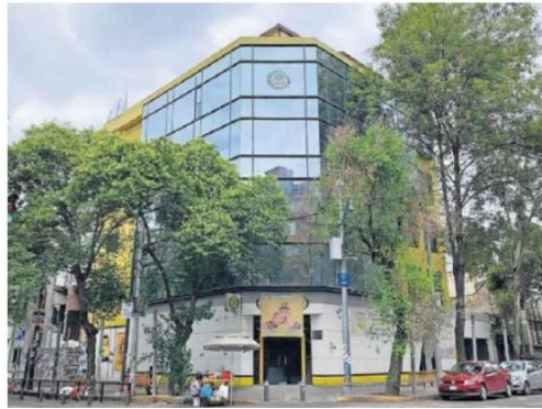
El edificio de Jalapa, en la colonia Roma, seguirá siendo la sede del PRD Ciudad de México.

El nuevo partido político tendrá 60 días hábiles para realizar las modificaciones. Tendrá acceso a las prerrogativas de tiempo de aire en radio y televisión y financiamiento público. ●