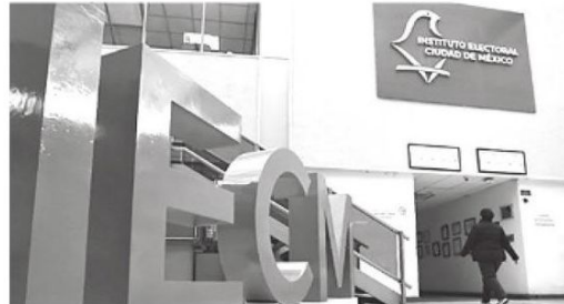
· Busca construir una ciudad más democrática

Con este nuevo enfoque, el IECM consolida su imagen como una institución confiable e innovadora.