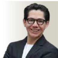
POR ALBERTO TAVIRA