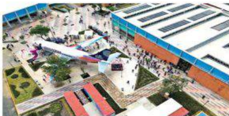
El sistema de cuidados de Iztapalapa se tradujo en la construcción de 16 Utopías en esa alcaldía.