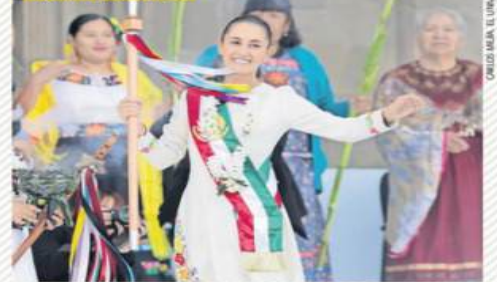
La Presidenta recibió el bastón de mando a nombre de 113 mujeres de las 70 etnias del país, el cual representa el poder comunal.

EL PESO ABRIÓ EL NUEVO SEXENIO SIN TURBULENCIAS: COTIZÓ EN 19.61 UNIDADES POR DÓLAR | CARTERA | A24