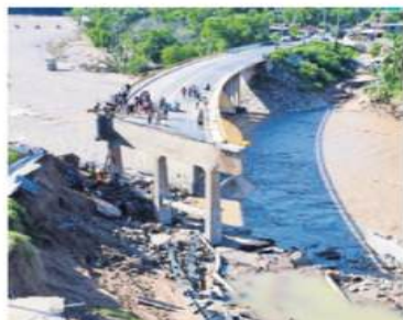
Con ayuda de voluntarios, la gente baja del puente en tres escaleras unidas con lazos.