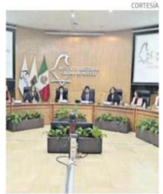
Las nuevas consejeras dicen impulsarán la participación.

"La contienda electoral ha quedado atrás, el pueblo los ha elegido y ahora deberán privilegiar el respeto mutuo y el diálogo democrático para colaborar entre autoridades", expresó.