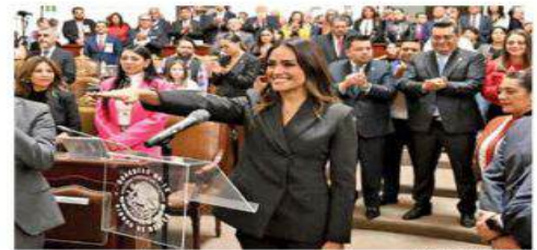
La alcaldesa dijo que habrá estrecha colaboración con las titulares de la Jefatura de Gobierno y de la Presidencia de la República.

Durante su primer evento como alcaldesa, en la explanada de la demarcación,