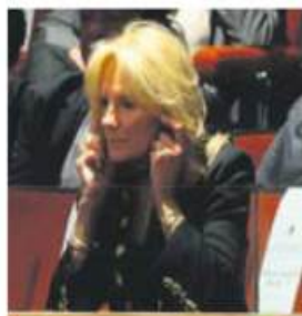
TESTIGO. Jill Biden, primera dama de EU, en el Congreso.