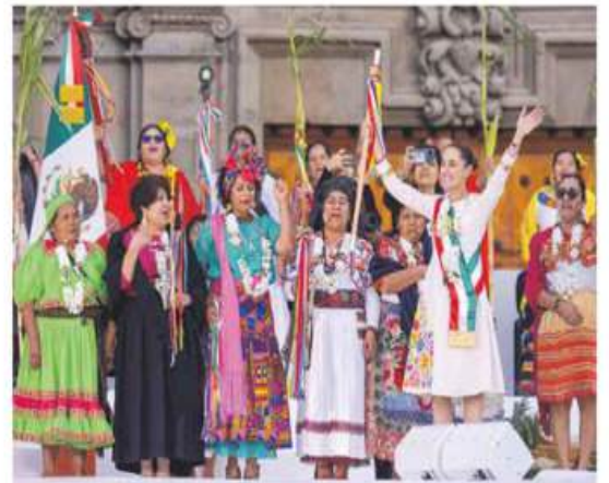
CELEBRA EN EL ZÓCALO. Dio a conocer su plan de gobierno en 100 puntos y prometió diversas reformas constitucionales, incluida la del sistema electoral. PÁG. 7