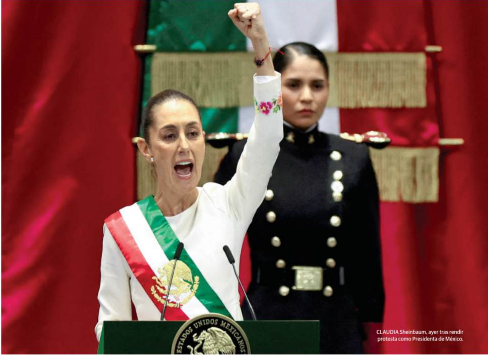
CLAUDIA Sheinbaum, ayer tras rendir protesta como Presidenta de México.