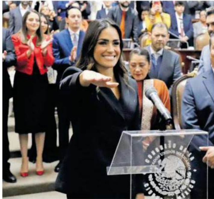
Alessandra Rojo de la Vega asumió como alcaldesa de Cuauhtémoc