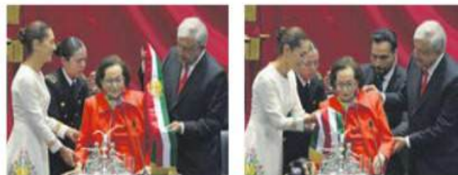
ACTO. López Obrador e Ifigenia Martínez colocaron la banda a Sheinbaum.