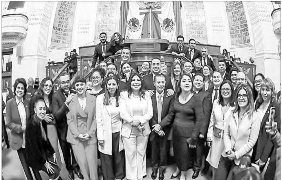
▲ El Congreso capitalino tomó protesta a los 16 alcaldes, de los cuales 12 ocuparán el cargo por los próximos tres años, mientras los de Coyoacán, Miguel Hidalgo, Tláhuac y Venustiano Carranza estarán al frente por otro periodo similar.

Empezó más de media hora tarde // Urgía a morenistas acudir al Zócalo // Son 12 nuevos titulares // Cuatro repiten en el cargo