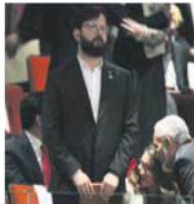
PRESENTE. El presidente de Chile, Gabriel Boric, ayer.