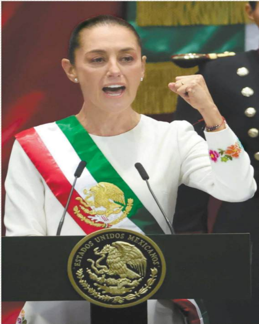
Ya con la Banda Presidencial, Claudia aseguró que gobernará bajo los principios del humanismo mexicano.

Al asumir como la primera Presidenta de México, Claudia Sheinbaum dijo que en su mandato no se utilizará la fuerza del Estado para reprimir al pueblo y garantizó seguridad en las inversiones nacionales y extranjeras. Entre sus 100 compromisos destacan la creación de las Farmacias del Bienestar y reformas contra el nepotismo y la reelección.