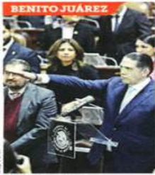
BENITO JUÁREZ Luis Mendoza.