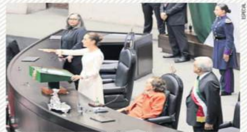
Sheinbaum estuvo acompañada de la presidenta de la Corte, Norma Piña, y de la presidenta del Congreso, Ifigenia Martínez.

El de ayer fue un día histórico y simbólico, con las tres protagonistas del Ejecutivo, Legislativo y Judicial juntas en la toma de posesión.