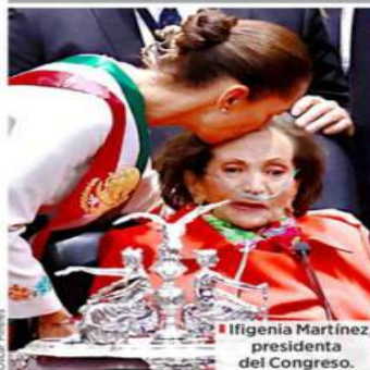
Ifigenia Martínez, presidenta del Congreso.

Ayer se vivió una histórica jornada dominada por las mujeres políticas, líderes, artistas, soldadas y ciudadanas.