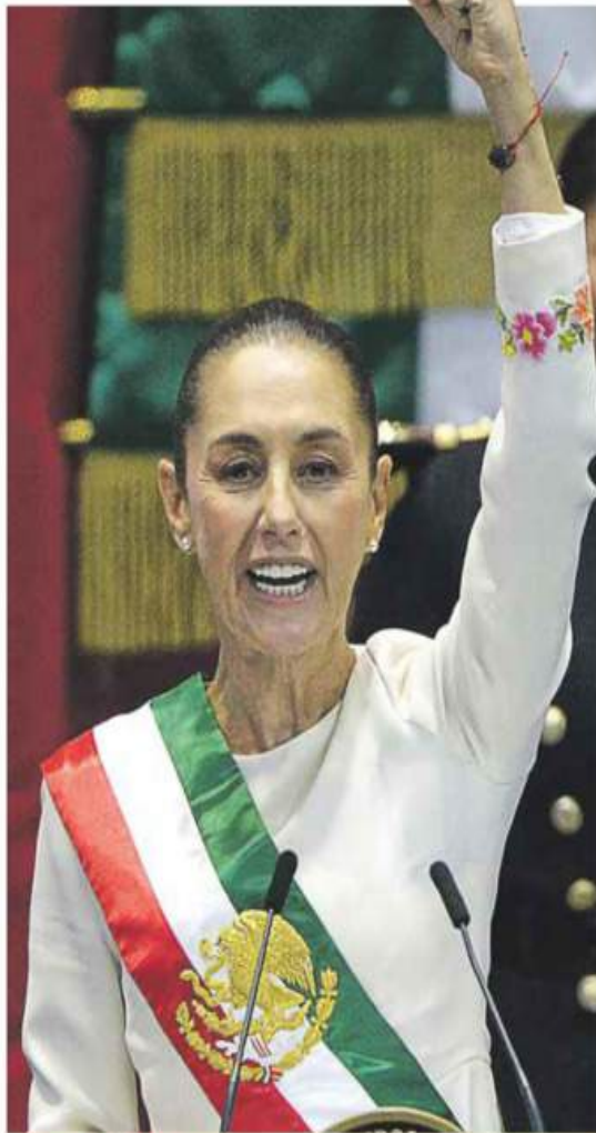
TIEMPO DE MUJERES. "Soy madre, abuela, científica y mujer de fe, y, a partir de hoy, presidenta constitucional de México".