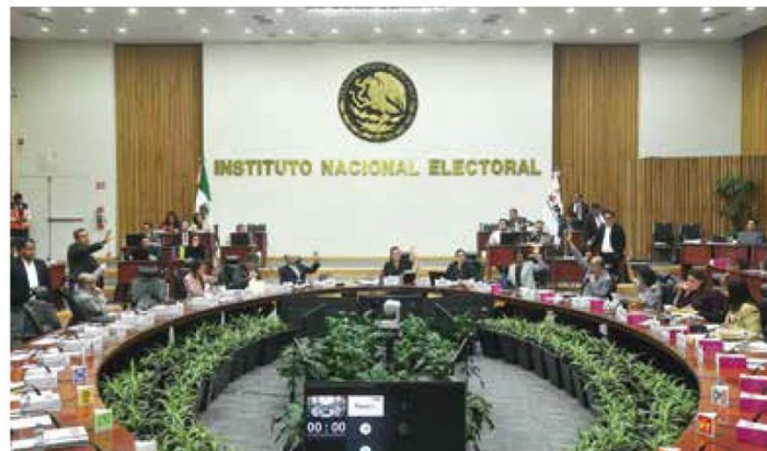
● AUTORIDAD. Aspectos de una sesión en el INE.

2 También hay tres consejeros presidentes con solicitud de remoción.