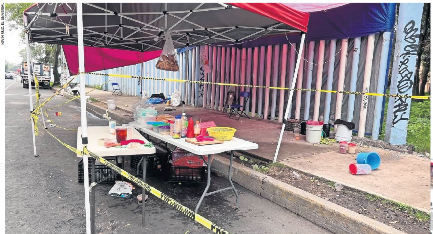
Los enseres de la chelería en donde el pasado viernes un hombre ejecutó a tres personas en la colonia Carmen Serdán, en Coyoacán, permanecen en el sitio.

han sido desarticuladas en la alcaldía Coyoacán durante toda la administración, precisaron.