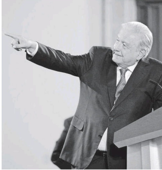
El Presidente habló ayer del caso Ayotzinapa en Palacio Nacional