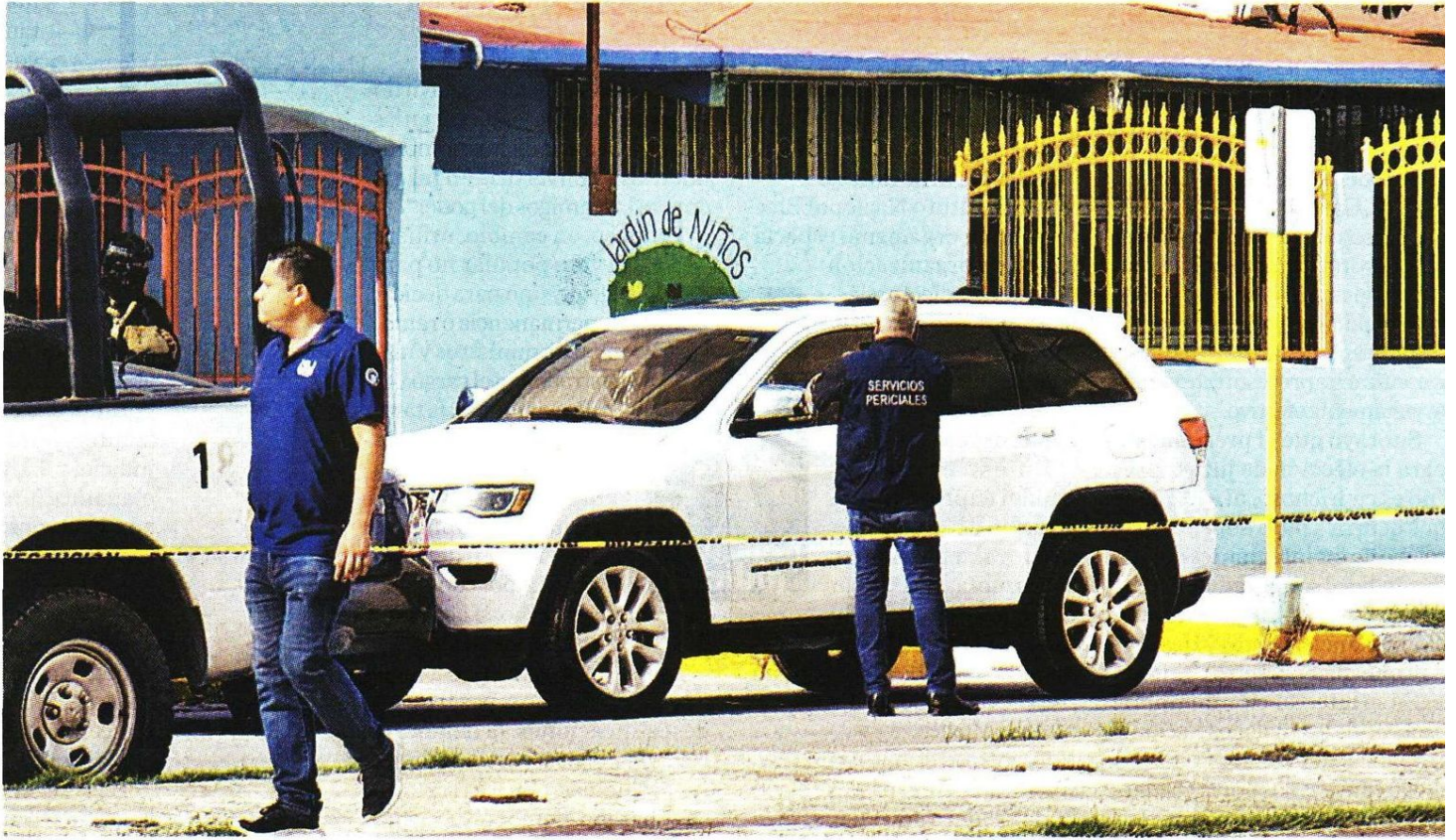
El ex candidato estatal fue atacado frente a la sede del organismo gremial en Matamoros.