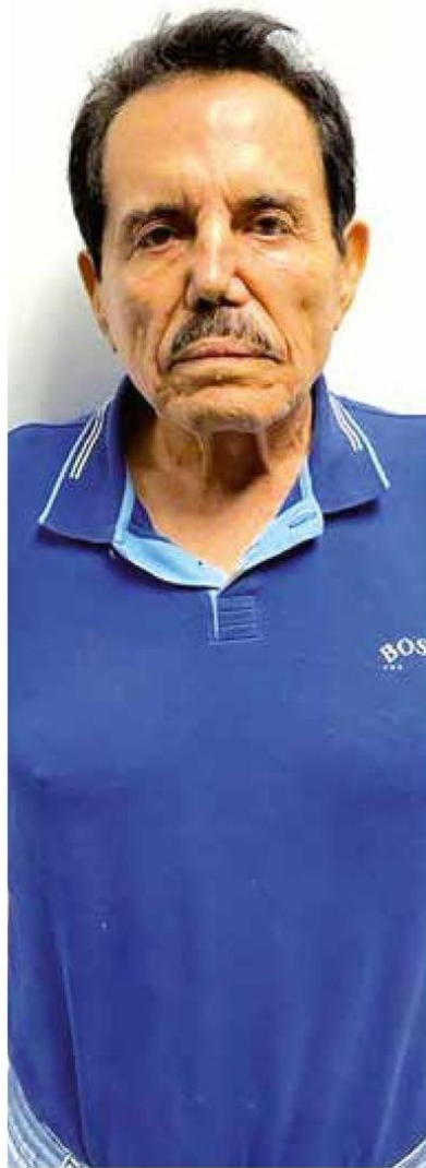
Detenido. Ismael Zambada García, el Mayo, fue capturado en EU.