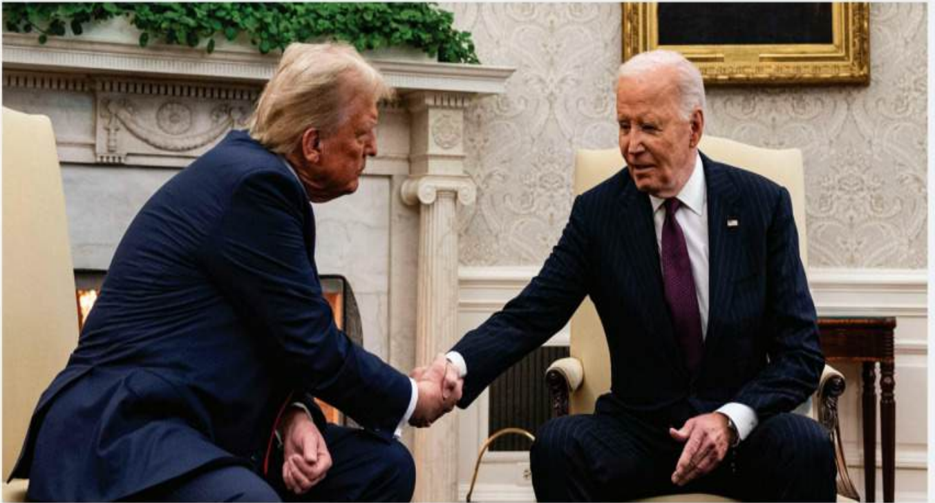
BIDEN OFRECE TRANSICIÓN ORDENADA A TRUMP. PAG. 20