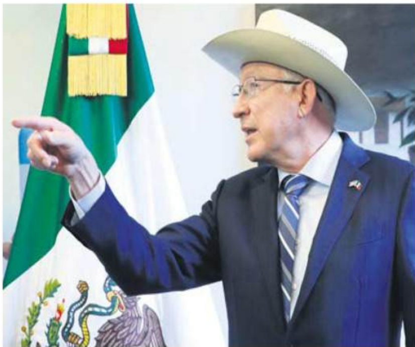
Detalles. Ken Salazar, embajador de Estados Unidos en México, ayer, en conferencia de prensa.

"El otro lado es cumplir con la ley. Y ahí es donde, cuando se dice: 'no hay problema, tenemos estas cifras' que le dicen al pueblo que no hay problema, no está basado en la realidad. Eso quiere decir que la austeridad, como se dice, republicana, no va a trabajar para llegar a tener una seguridad para el pueblo de México", añadió.