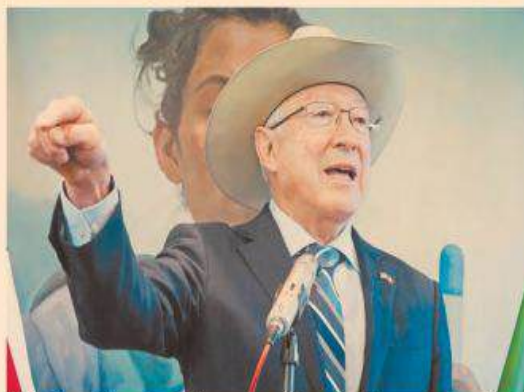
El diplomático de EU afirmó que si bien el gobierno mexicano habla de que hay seguridad, hay casos como el de Sinaloa que lo contradicen.

Salazar confió en que la visión y el plan de seguridad de la presidenta Claudia Sheinbaum sean una realidad, aunque reiteró que debe haber más inversión porque “la austeridad republicana no va a servir”.