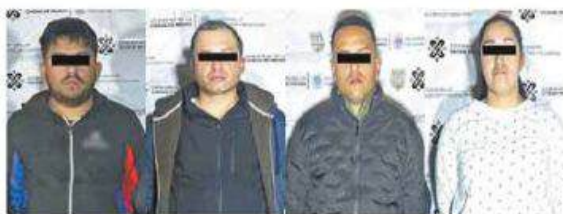
Los arrestos ocurrieron en 2 predios, uno en Iztacalco y otro en VC.