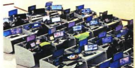
El personal del CS es el encargado de operar la nueva línea 55 5036 3301, enfocada en atender el delito de extorsión.

Al finalizar la comunicación, la operadora del CS proporcionó al denunciante el folio del reporte y el número de la Unidad Antisequestro, que es la encargada actualmente de atender los casos de extorsión en la capital.