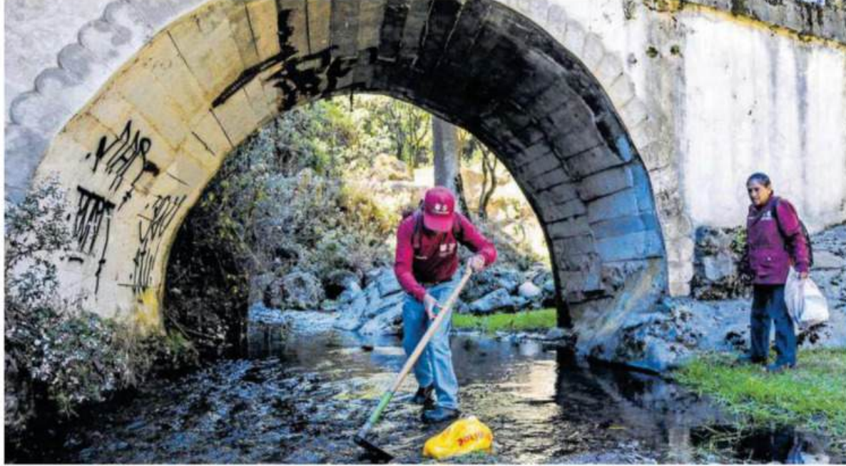
El Río Magdalena, con 20 kilómetros de extensión, es el único caudal que no ha sido entubado en la Ciudad de México