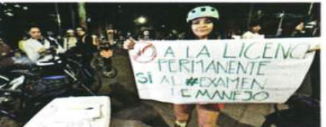
Los activistas protestaron contra la inseguridad vial.