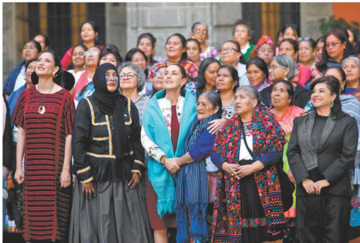
La mandataria y Clara Brugada durante el Encuentro de Arte Textil Mexicano en el patio central de Palacio Nacional. ARACELI LÓPEZ