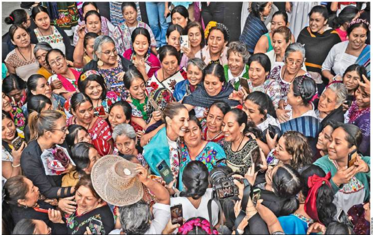
ARTECONAMOR. Los colores y el talento de las mujeres fueron protagonistas durante la inauguración de Original. El Encuentro de Arte Textil Mexicano se llevará a cabo a partir de hoy y hasta el 17, en Los Pinos MÉXICO P. 7