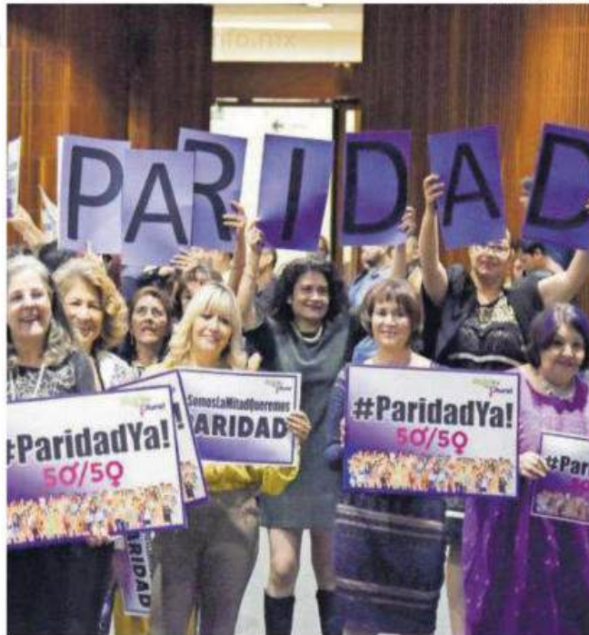
En la Cámara de Diputados, se han aprobado leyes para impulsar la paridad y la equidad de género.

Asimismo, destacó los avances en participación e igualdad como el reconocimiento de la diversidad: paridad de género en la integración de los órganos del Estado; democracia paritaria; reconocimiento de la Violencia Política contra las Mujeres en Razón de Género; y cambio de temas de la agenda política.