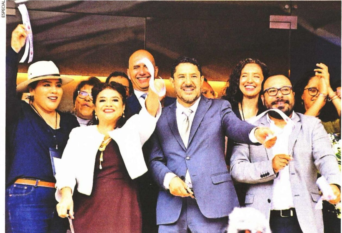
La jefa de Gobierno electa, Clara Brugada, retomó las actividades públicas al acudir a la inauguración de la Utopía Ixtapalcalli, en Iztapalapa. En el evento estuvo acompañada por el mandatario capitalino, Martí Batres.