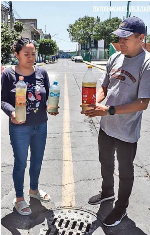
VIGILANCIA. Personal de Pemex, Sedena y Guardia Nacional recorren la colonia Cuchillo del Tesoro para verificar la situación que prevalece en las coladeras.