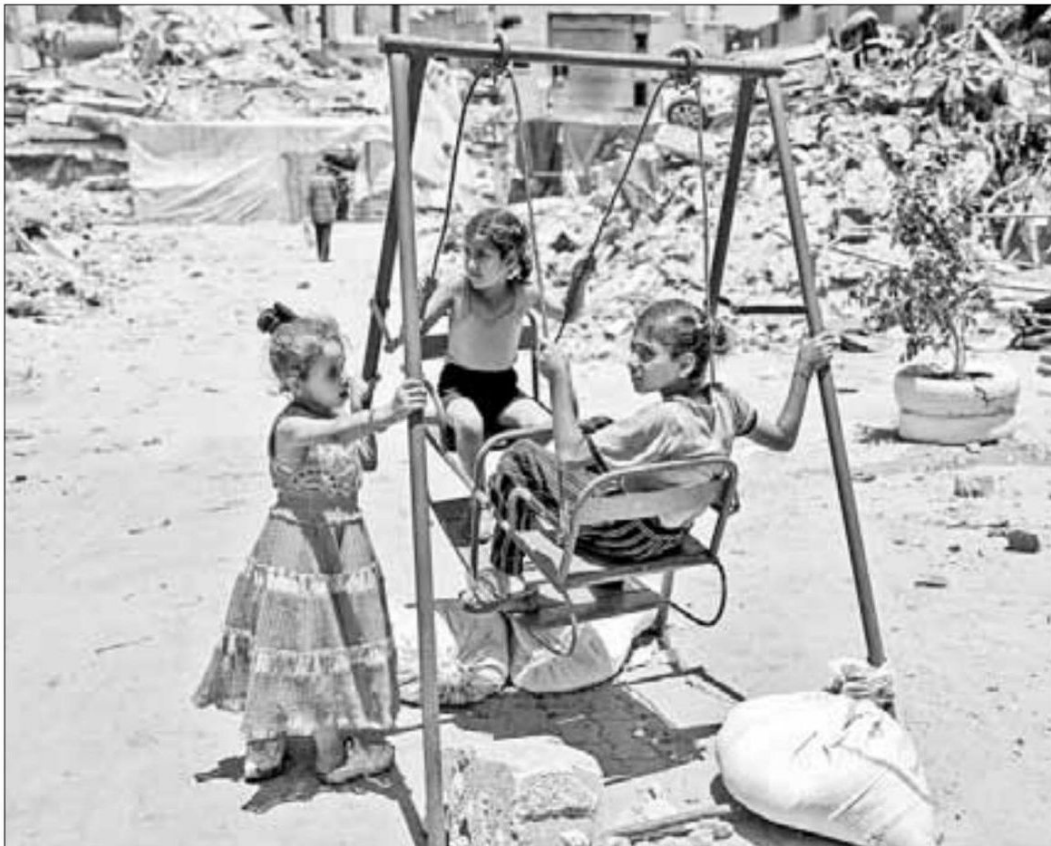
▲ Niños palestinos se distraen en el campo de refugiados de Jabaliya, en el noreste de la franja de Gaza.