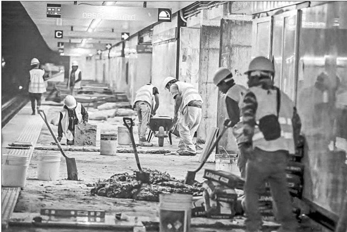
▲ El corporativo incumplió los tiempos de entrega, a pesar de que lleva más de dos años de labores.