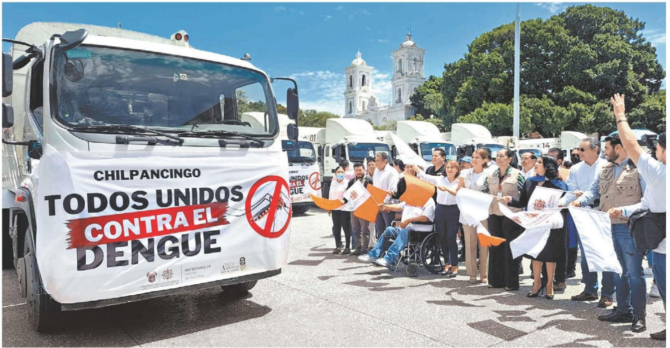
Campana para mitigar el mosquito impulsada por el gobierno de Chilpancingo. ROGELIO AGUSTÍN