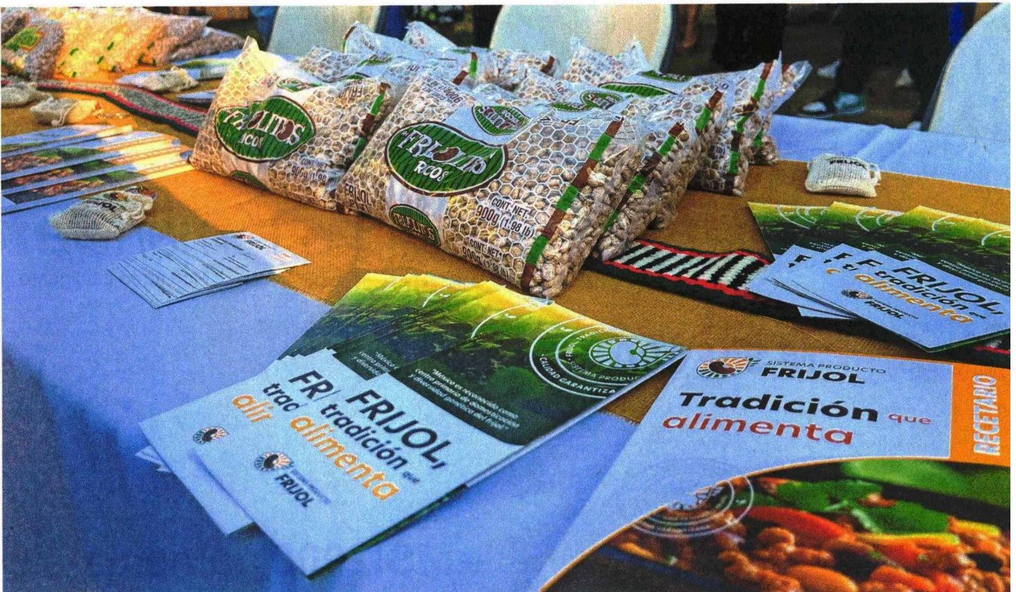
Productores de frijol de Chihuahua admiten que se registran bajas en la producción de la leguminosa, así como en las ventas y el consumo humano.