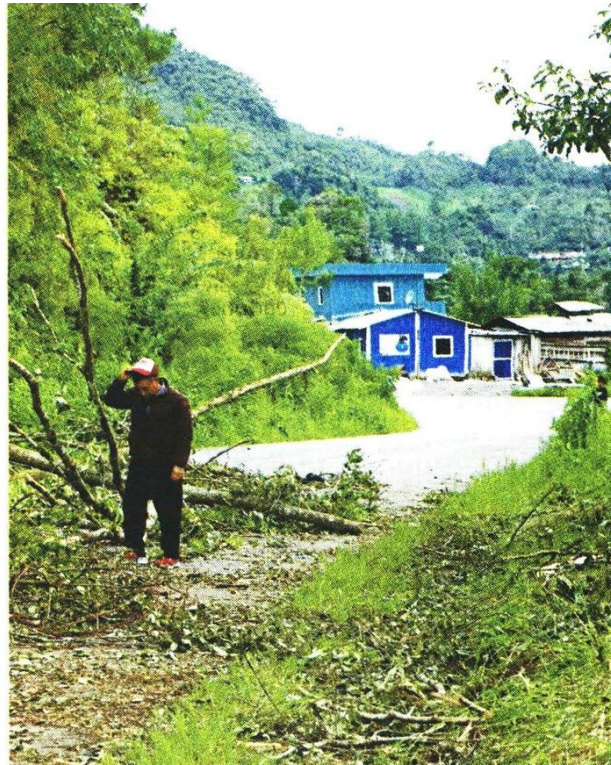
■ Los grupos armados han bloqueado la carretera con troncos de árboles para impedir el acceso a la comunidad.

Algunas personas han reportado en redes sociales, que la escuela primaria donde se resguardan los desplazados de la comunidad indígena recibió impactos de bala, mientras que Protección Civil Estatal no ha podido ingresar para dejar alimentos a los indígenas.