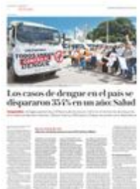
Los casos de dengue en el país se dispararon 354% en un año. Salud