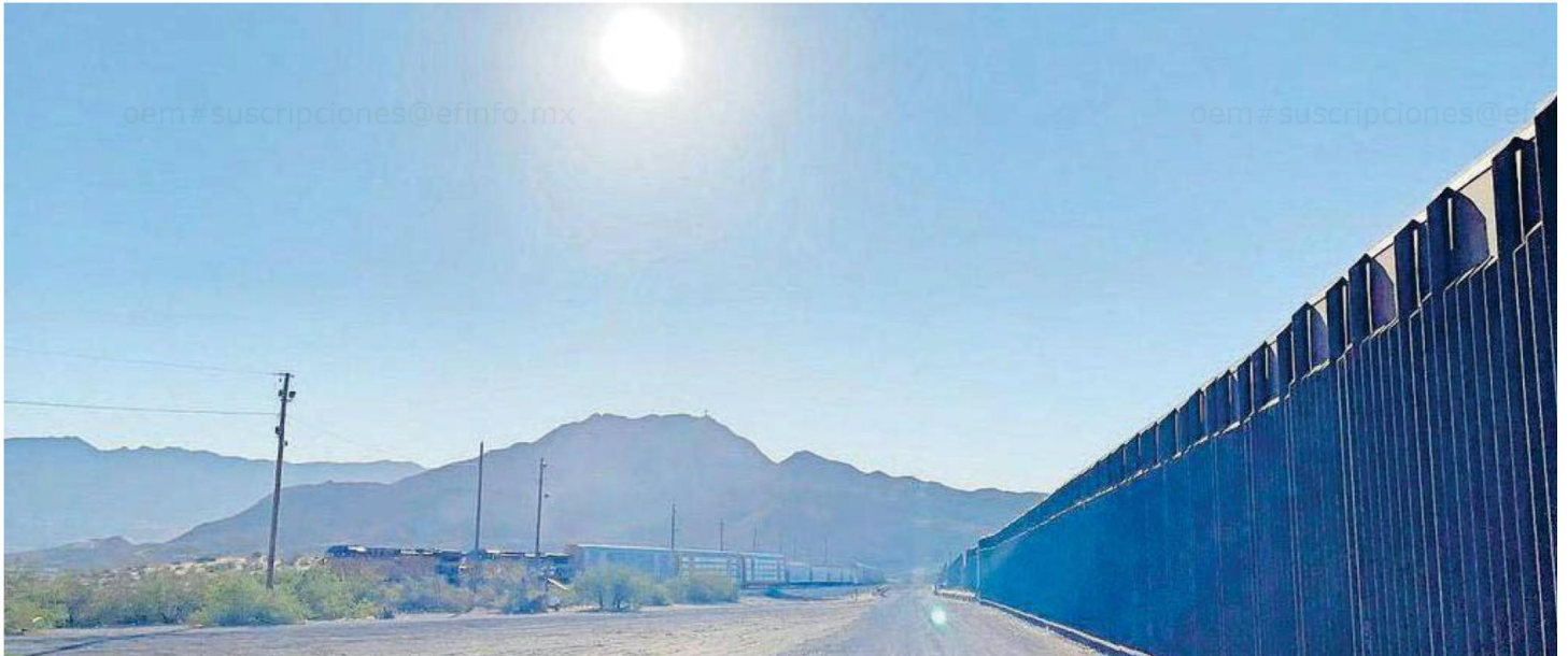
Sólo en el Sector El Paso hay unos mil 600 agentes fronterizos que vigilan día y noche la zona, apoyados por equipos como patrullas, drones, helicópteros y cámaras