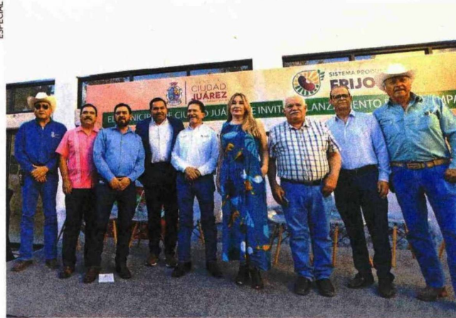
Productores de frijol de Chihuahua impulsan una campaña para que se reconozca la riqueza de este alimento y aumente su consumo, detallan.