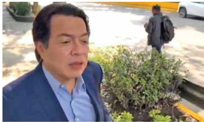
• VISITA. Delgado fue a la casa de transición de Claudia Sheinbaum.