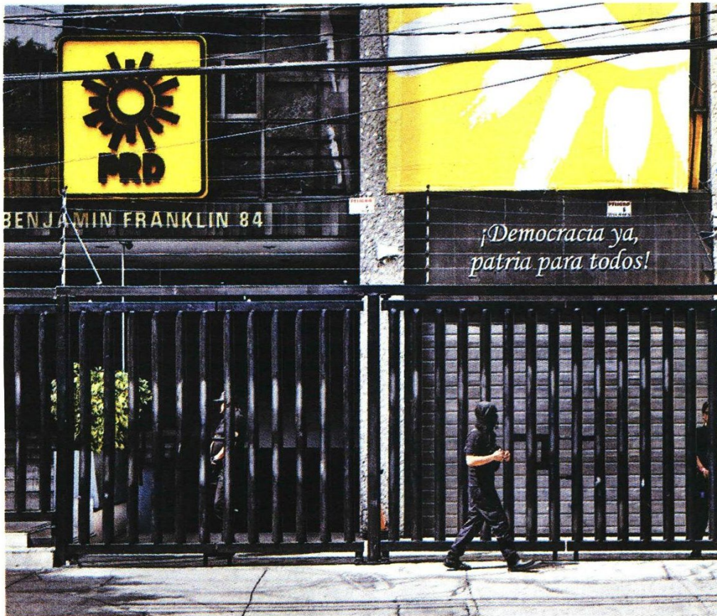
Instalaciones del organismo en la capital del país.