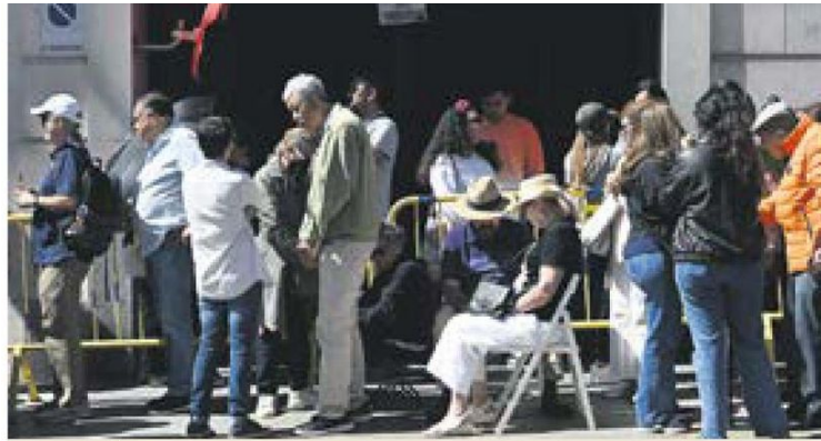
ELECCIÓN. Mexicanos, en la embajada en Madrid, el pasado 2 de junio.