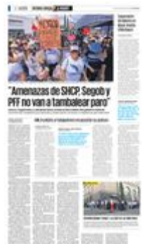
El paro no es una huelga, es una suspensión de actividades y se continúa impartiendo justicia afuera de las oficinas, por lo que los trabajadores dijeron que no cederán.