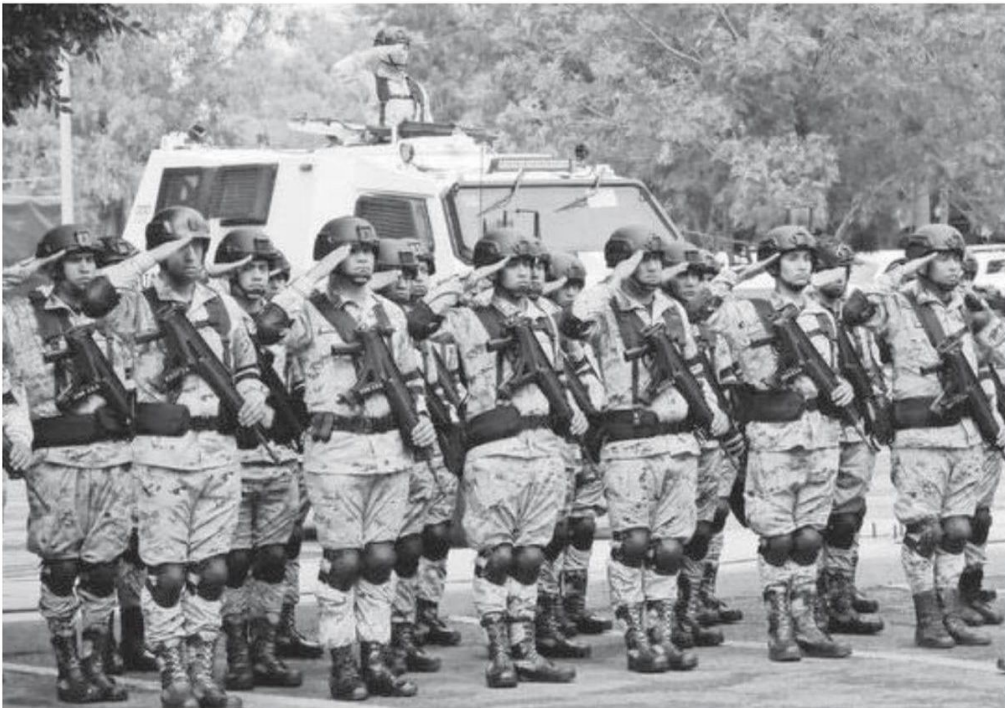
Elementos de la Guardia Nacional durante una ceremonia en la alcaldía Iztapalapa