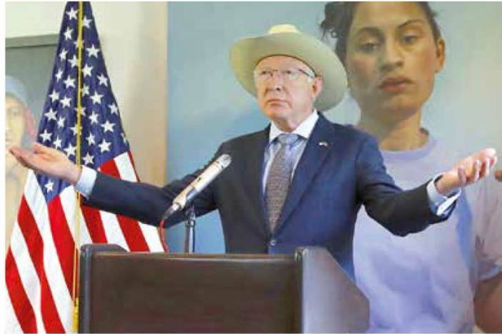
Alerta. Ken Salazar, embajador de EU en México, ayer, en conferencia de prensa.