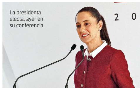
La presidenta electa, ayer en su conferencia.