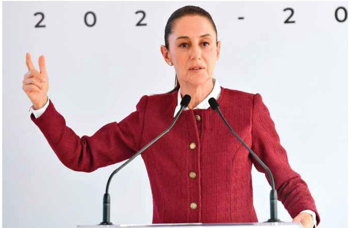
CRISTALINO | • Sheinbaum dijo que será un proceso bajo los principios de legalidad y objetividad.

3 • Dijo que el PEF 2025 corres- ponde a la próxima adminis- tración, pero van a ayudar.