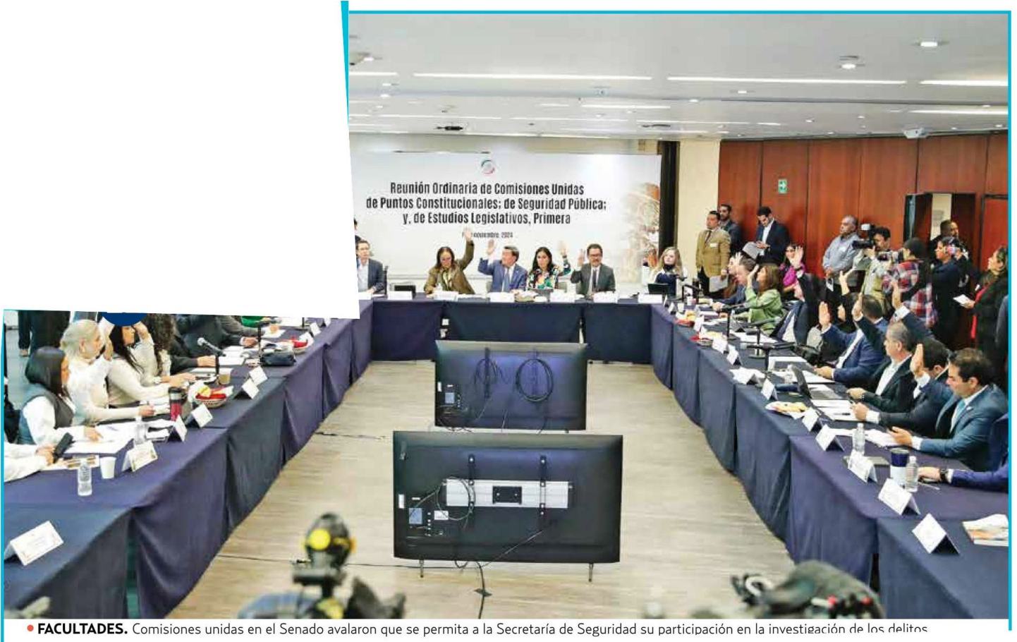
• FACULTADES. Comisiones unidas en el Senado avalaron que se permita a la Secretaría de Seguridad su participación en la investigación de los delitos