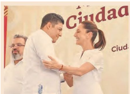
La presidenta de México Claudia Sheinbaum, recibió a los mandatarios de Estados con convenio para la federalización de los servicios de salud.

Además, la implementación de tres programas del bienestar nuevos: apoyo a las mujeres adultas mayores a través de la Pensión Mujeres Bienestar, becas estudiantiles para alumnos y alumnas de preescolar hasta secundaria de escuelas públicas, misma que iniciará con el apoyo a estudiantes de secundaria en el 2025; y el programa de salud casa por casa, en donde médicos visitarán mensual o bimestralmente las casas para un monitoreo, acciones que fortalecen el apoyo que el Gobierno Estatal brinda.