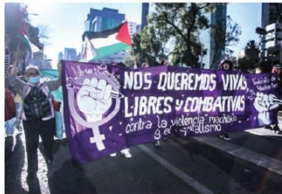
ESTUDIANTES y activistas protestan ayer en contra de la violencia de género.