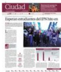
OLIMPIA Coral y víctimas de Diego "N" marchan ayer rumbo al Zócalo para exigir justicia en este caso y en los de feminicidios.