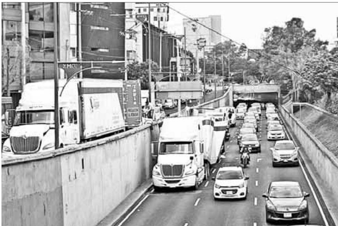
▲► Camiones de la RTP apoyaron con el traslado de usuarios afectados por la interrupción del servicio en la línea 2 del Metro. En el bajopuente de avenida Coyoacán y Viaducto, un tráiler quedó atorado, lo que provocó caos vehicular.