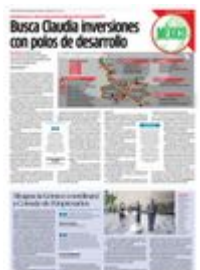
GRÁFICO: XAVIER RODRÍGUEZ