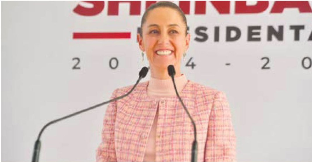
MENSAJE. La virtual presidenta, Claudia Sheinbaum.