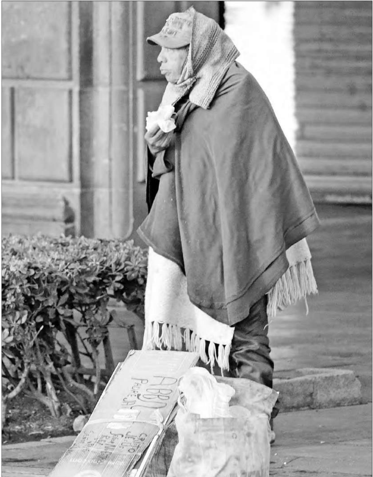
► Ante las bajas temperaturas que ya se dejan sentir en la capital del país, autoridades capitalinas recomendaron a la población usar al menos tres capas de ropa, de preferencia de algodón o lana.