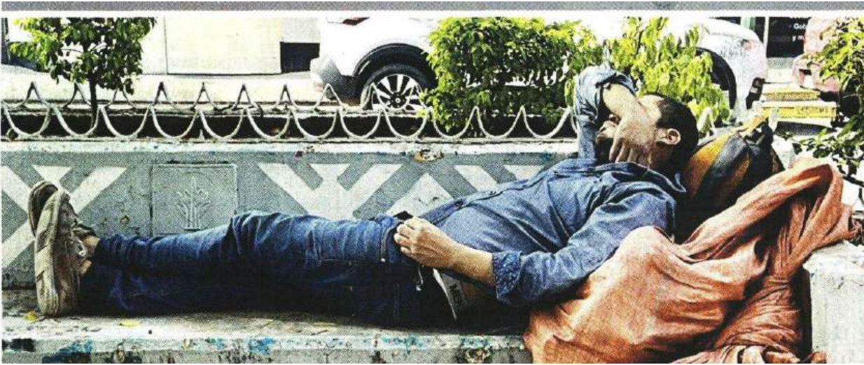
■ Sobre Calzada de Guadalupe. Después de Cuauhtémoc, GAM es la Alcaldía con más población callejera en la CDMX.

“Da miedo, dan medicamentos, estás encochado, creo que un albergue está bueno, pero ya para las personas que están locas, porque ya no razonan”, concluyó.