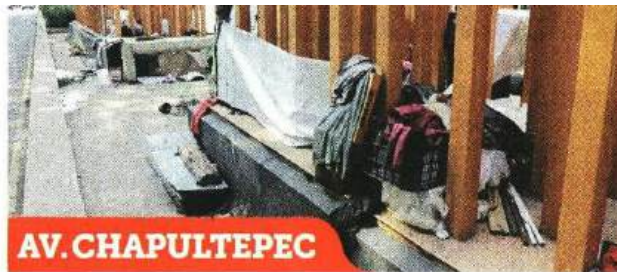
■ La Cuauhtémoc concentra la población callejera, incluso en Av. Chapultepec han tomado el camellón.