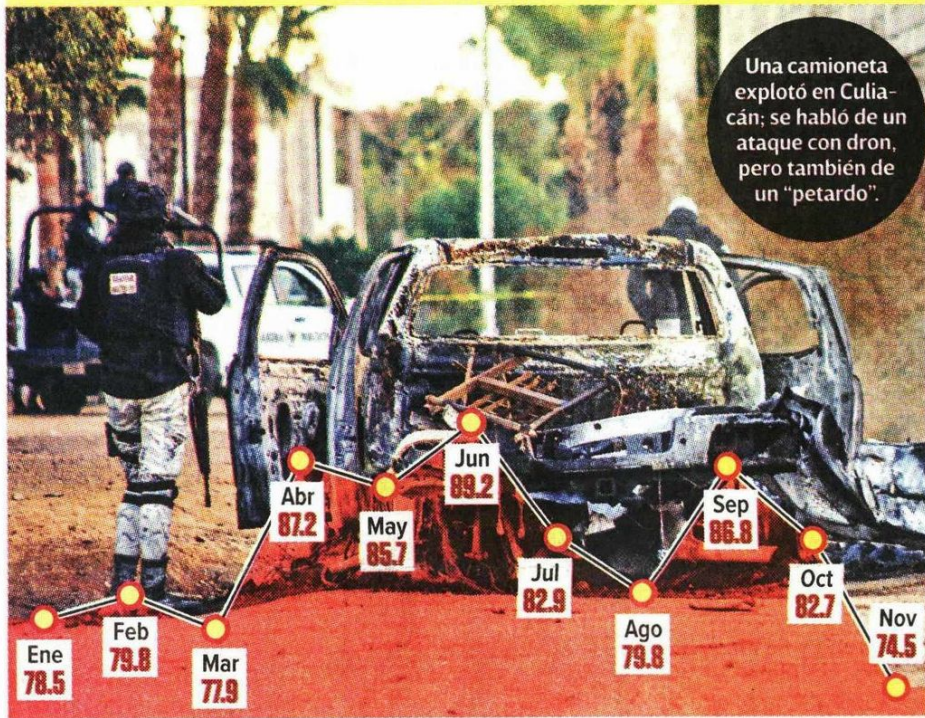
Gráfico: Abraham Cruz