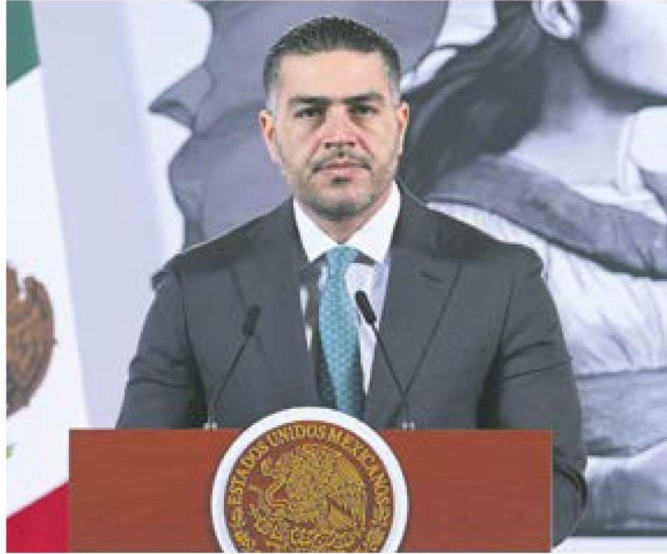
Anuncio. El secretario de Seguridad y Protección Ciudadana, Omar García Harfuch.

de pesos es la afectación económica a los grupos delictivos, según García Harfuch.