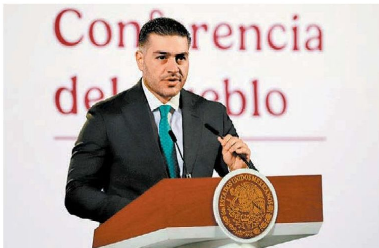
El secretario de Seguridad en la conferencia mañanera. JAVIER RÍOS

· FUENTE: Registro Nacional · INFORMACIÓN: Xavier Jiménez · INFOGRAFÍA: Mauricio Ledesma