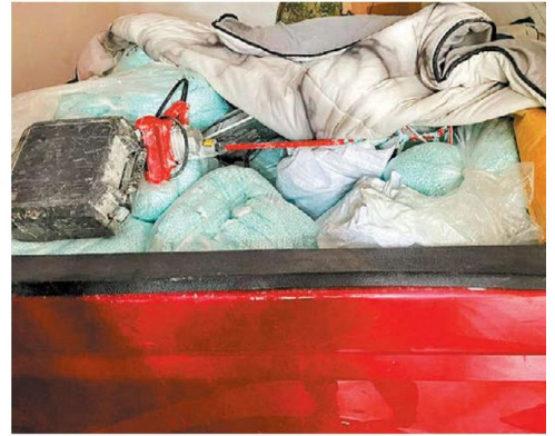
Aspecto de la camioneta que explotó durante la madrugada y narcóticos decomisados.