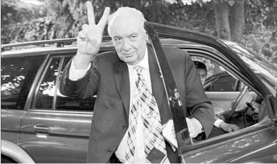
► El fiscal para delitos electorales, en imagen del 20 de agosto de 2008, a su llegada a una reunión de López Obrador con intelectuales en la casa de Ifigenia Martínez.