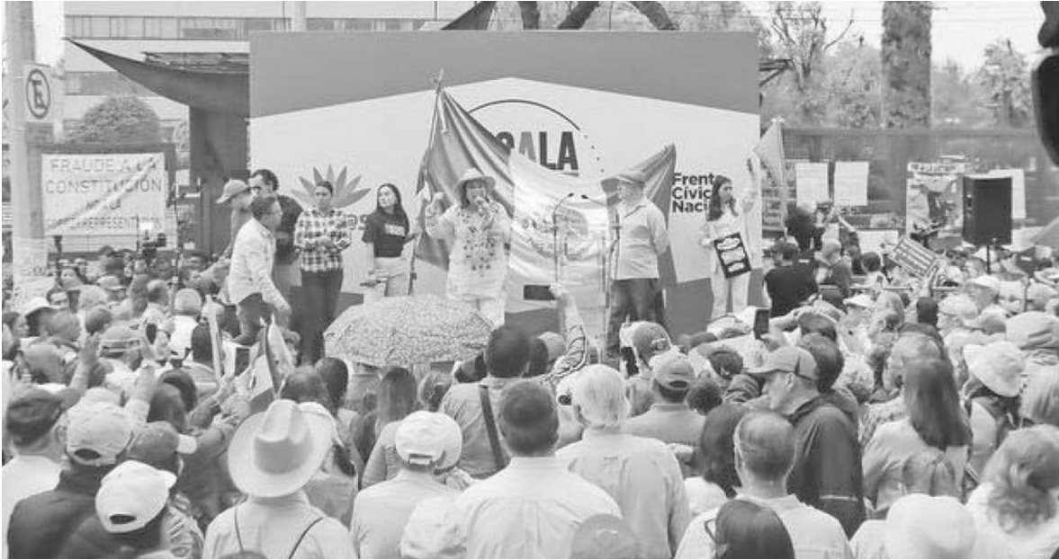
La Marea Rosa se manifestó ayer afuera del Instituto Nacional Electoral