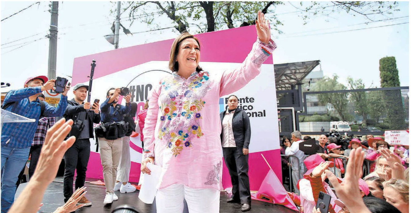
La ex candidata presidencial Xóchitl Gálvez durante la manifestación. ARIANA PÉREZ