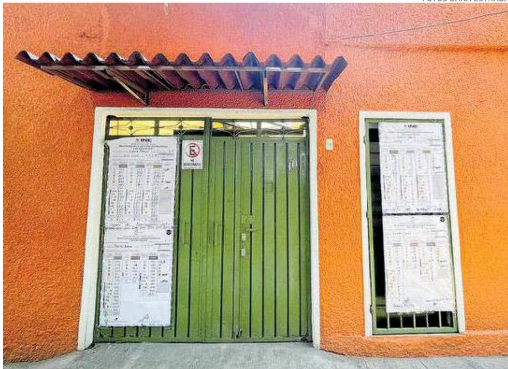
La casilla 4440 fue instalada en la calle Elisa de la colonia Nativitas, en la Benito Juárez