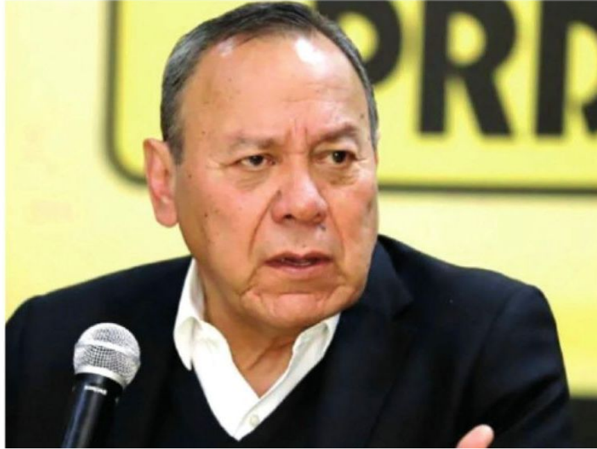
Presidenta capitalina del PRD se lanzó en contra de Zambrano