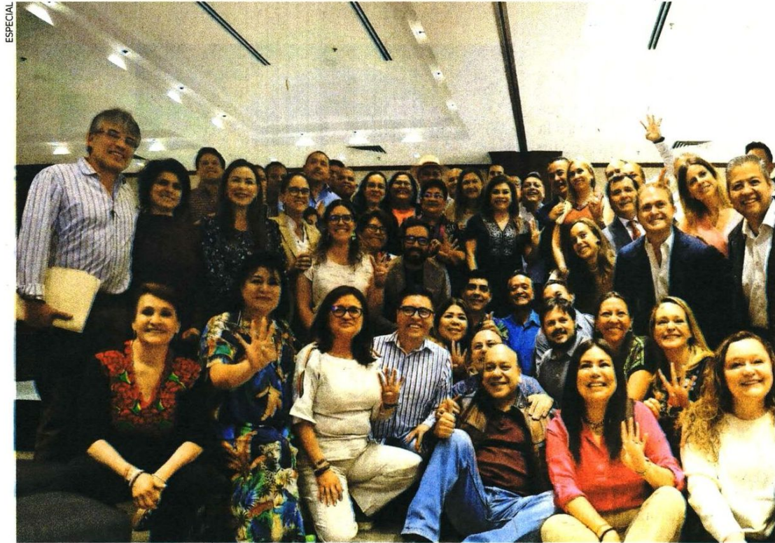
Clara Brugada, virtual jefa de Gobierno, destacó el trabajo realizado por todos los aspirantes de Morena, lo que permitió la participación histórica de 70% de la Lista Nominal.