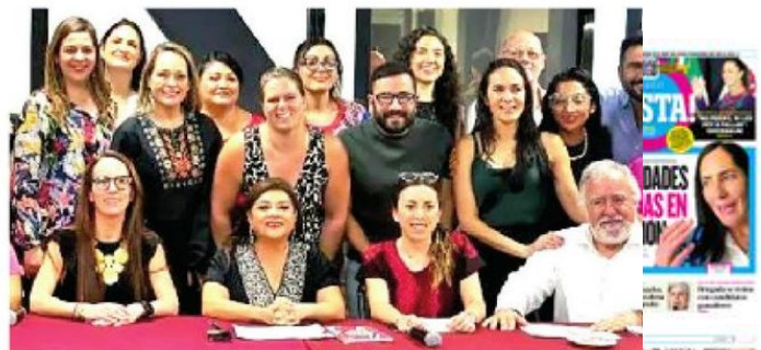
· Hablaron sobre los resultados electorales

· Declararon tener la meta de refrendar el triunfo en el 2027 por medio del desempeño de gobierno