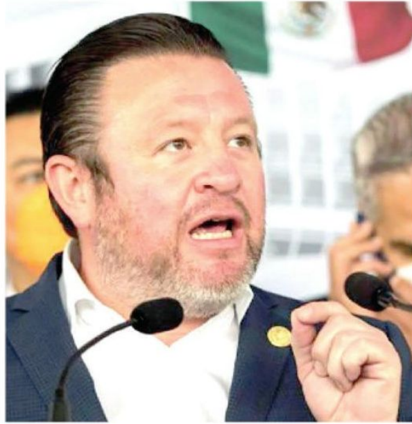
Priísta no cumplió, pero sí presumió