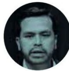
JORGE ÁLVAREZ MÁYNEZ