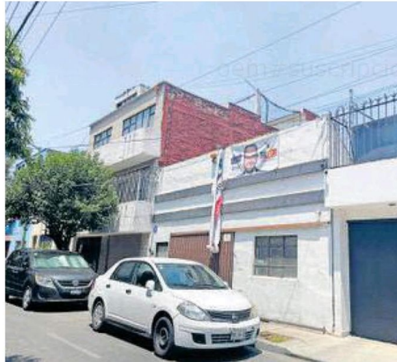
En los alrededores todavía hay mantas de Taboada