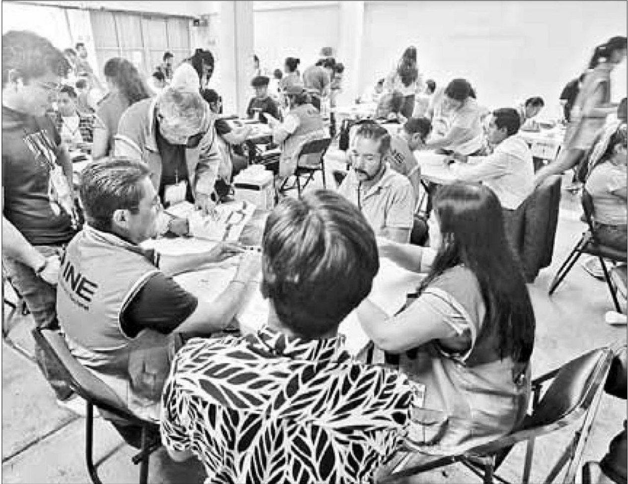
▲ En la junta distrital 15 de la alcaldía Benito Juárez, personal del INE participó en el recuento de los sufragios.