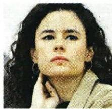
Luisa María Alcalde Ex diputada federal HOY: Secretaria de Gobernación

Algunos de los servidores públicos que en 2017 y 2018 fueron colocados en la nómina de encuestadores de Morena para recibir pagos de hasta 54 mil pesos mensuales: