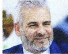
Alfredo Ramírez Ex candidato a diputado local HOY: Gobernador de Michoacán