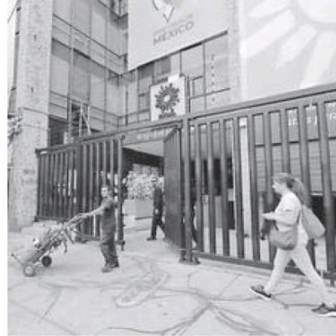
La sede del PRD en Benjamin Franklin