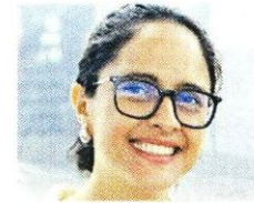
Gabriela Osorio Ex diputada de CDMX Hoy: Alcaldesa electa de Tlalpan