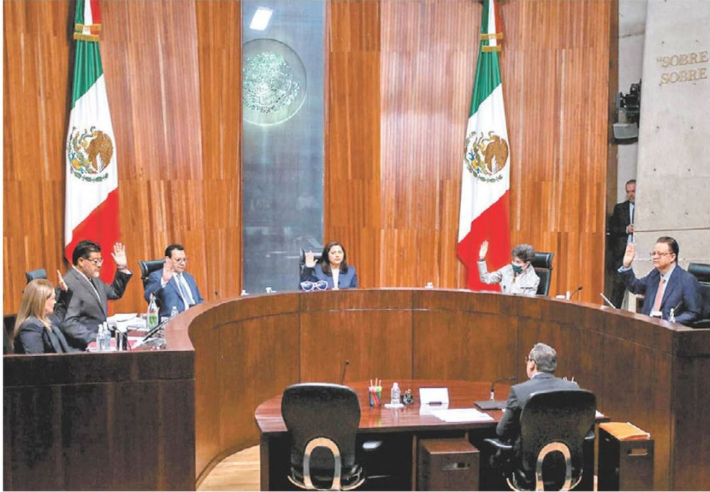
Sesión del lunes en la Sala Superior.