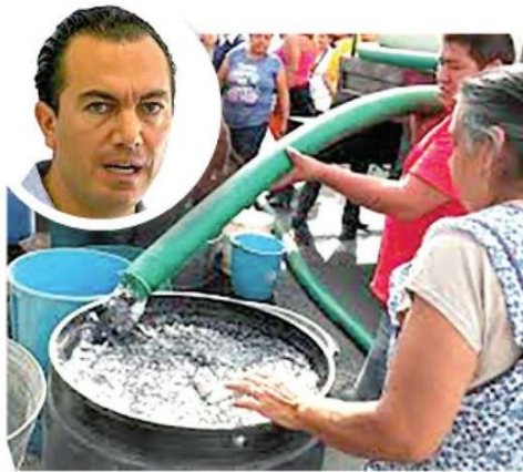
· Quieren agua, pero a través de red hidráulica

· La gente se opone a esta medida, porque no se aplica a los grandes desarrollos inmobiliarios, como Cumbres de Santa Fe