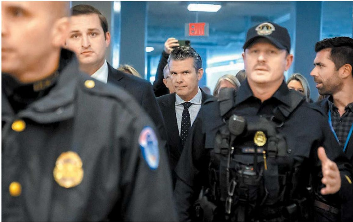
Pete Hegseth estuvo ayer en el Capitolio de Washington.