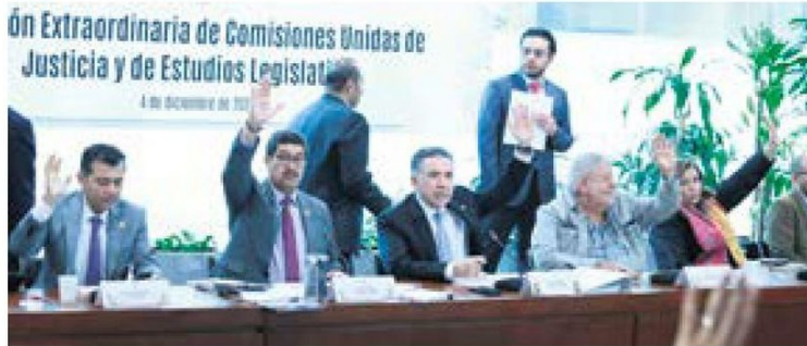
Sesión. El senador morenista Javier Corral [segundo de izq. a der.], ayer.

La priista Carolina Viggiano agregó que los cambios si bien podrían ser benéficos están “manchados de origen” porque la elección judicial implica la elección de “impresentables o absolutamente militantes de un partido”, conforme los registros que han sido públicos.