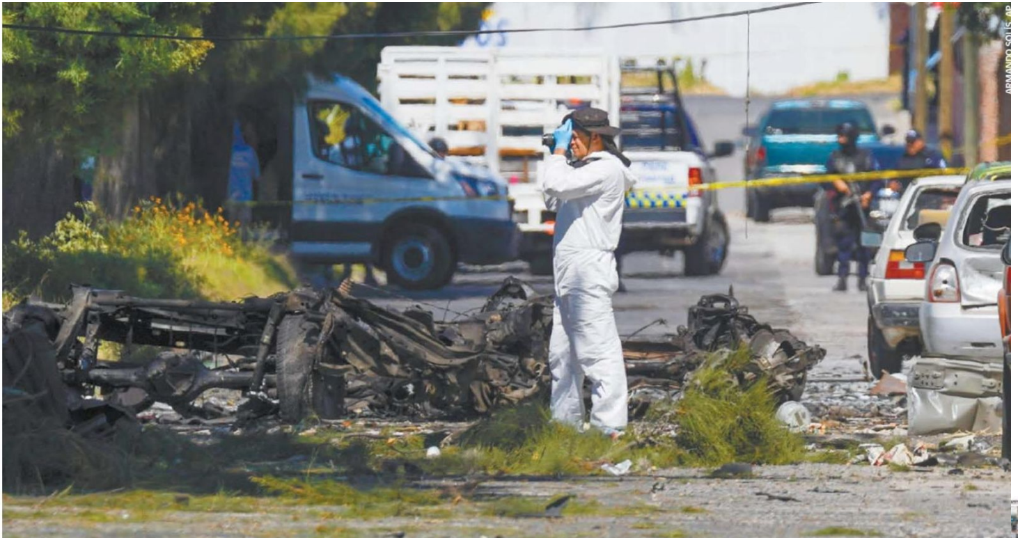
Un perito trabaja en la escena donde explotó un coche bomba cerca de una comisaría en Acámbaro, estado de Guanajuato.