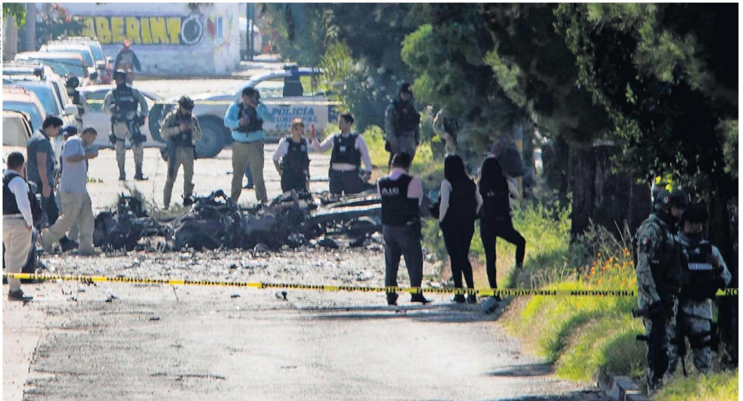
Expertos forenses, elementos del Ejército y de la Policía Estatal de Guanajuato resguardaron el lugar donde un coche bomba detonó en Acámbaro y dejó tres policías heridos.