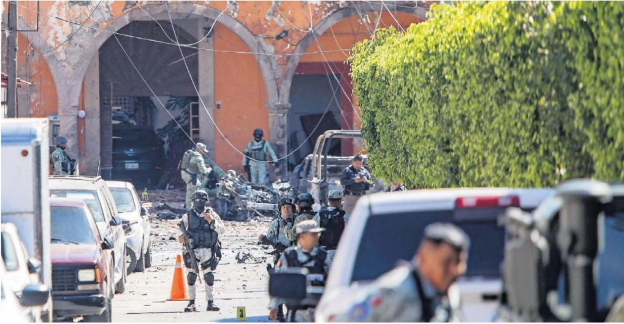
En Jerecuaro otro vehículo cargado con explosivos estalló provocando daños a oficinas, comercios y automóviles.