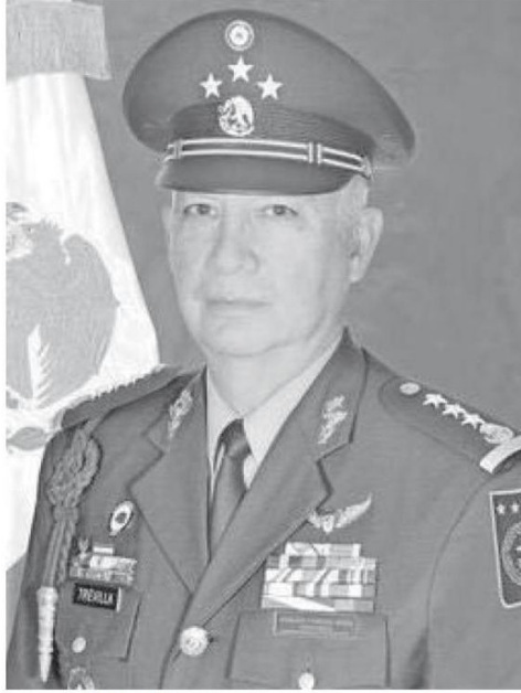
General de división Ricardo Trevilla Trejo