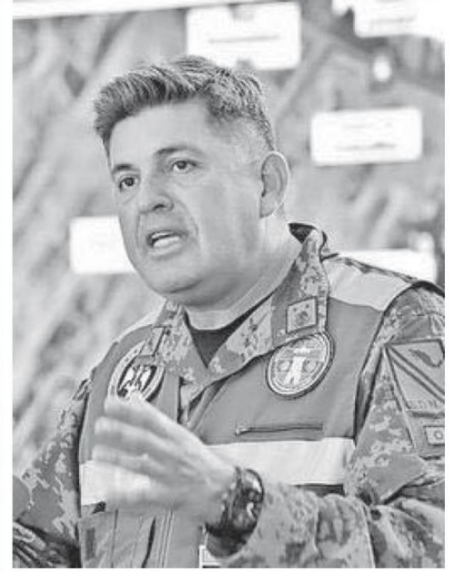
General ingeniero Gustavo Vallejo