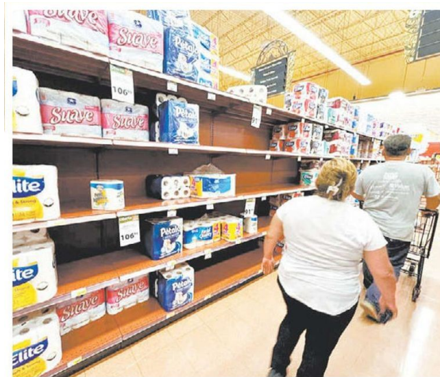
Anaqueles vacíos en supermercados de Monterrey.