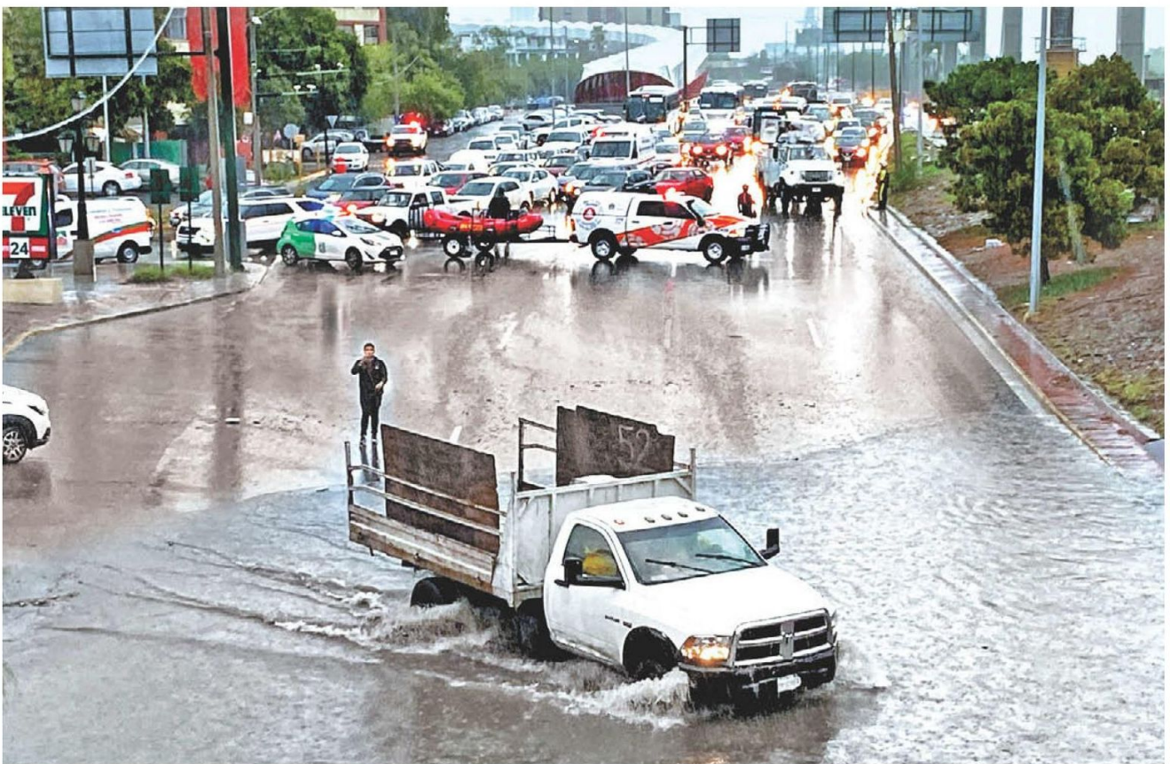
Las precipitaciones ocasionadas por el embate de Alberto anegaron las principales vías de la capital neoleonesa. ROBERTO ALANÍS

En Nuevo León las lluvias provocadas por las bandas nubosas de la tormenta Alberto provocaron la muerte de tres menores de edad, mientras que el fenómeno tropical impactó anoche entre Tamaulipas y Veracruz aún sin categoría de huracán. En Monterrey hubo compras de pánico en los supermercados y severas inundaciones. PAG.8