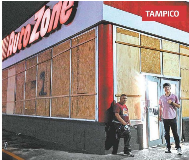
Protección a negocio en Tampico.