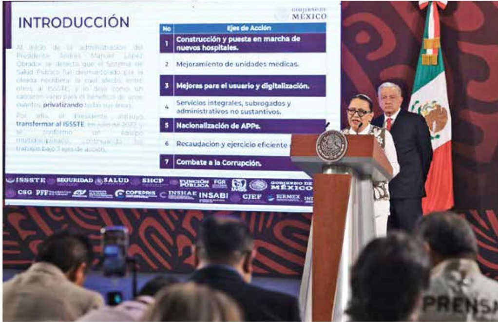
• LABOR. La secretaria de Seguridad y Protección Ciudadana dijo que se han mejorado los hospitales.