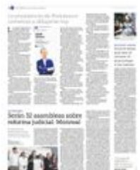
Conferencia. Ricardo Monreal, líder de Morena en San Lázaro, ayer.