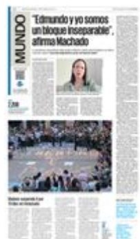
María Corina Machado llamó a México a usar su “canal de comunicación” con Maduro para que acepte “una solución” negociada a la crisis poselectoral.