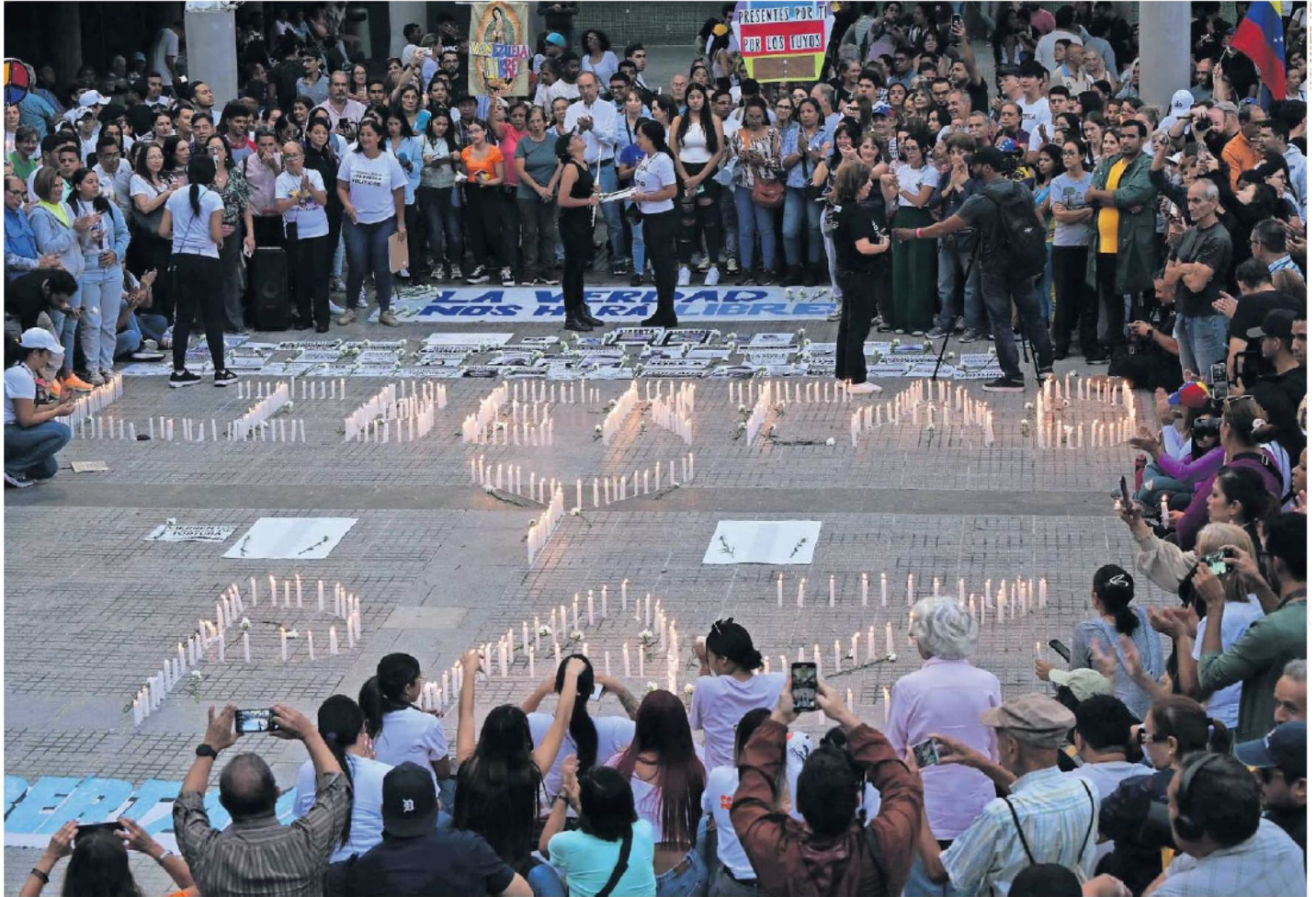
Asistentes a una vigilia convocada por la oposición exigiendo la libertad de los presos políticos arrestados durante las protestas poselectorales, en Caracas.