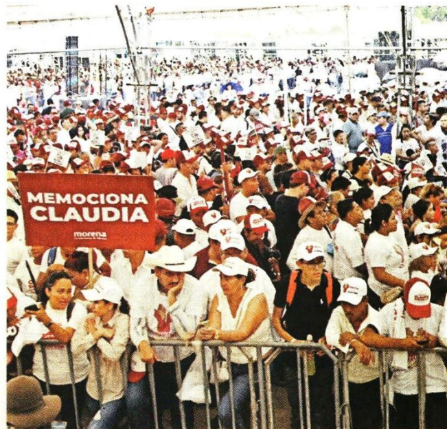
■ Claudia Sheinbaum logró el voto de casi el 60 por ciento de las personas que acudieron a las urnas el pasado domingo.