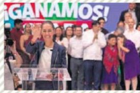
YARETZI M. OSNAYA. EL UNIVERSAL

Claudia Sheinbaum, virtual presidenta electa.