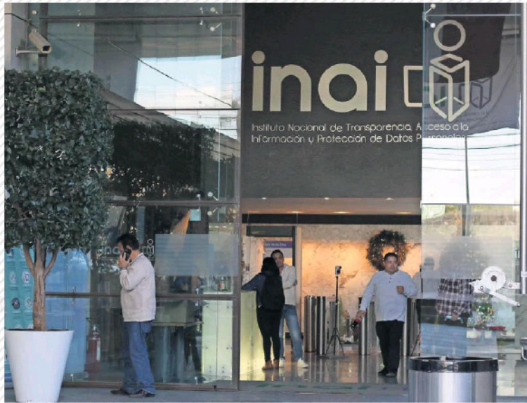
El plan C contempla la desaparición del Inai, cuyas funciones pasarían a otras dependencias.