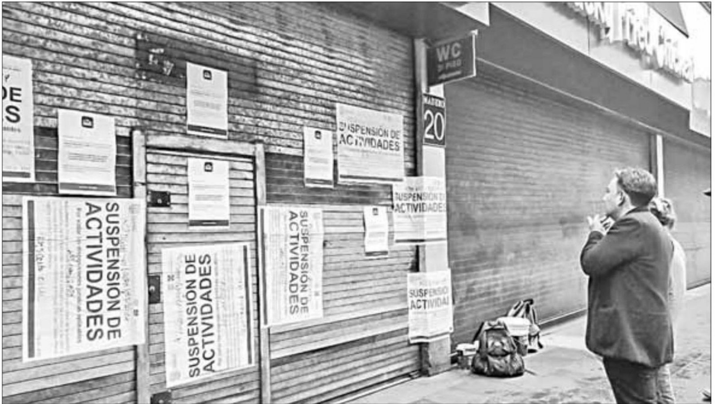
▲ Una semana después de que se conocieran los nombres de los dueños del edificio, éste fue cerrado.