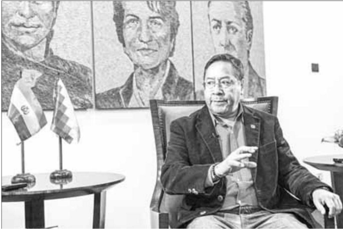
▲ Luis Arce, en entrevista con La Jornada, expuso que sintió temor por su vida cuando salió del palacio a enfrentar a los golpistas.