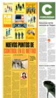
Gráficos: Horacio Sierra

7 Trabajo con personas en situación de calle en inmediaciones del Metro