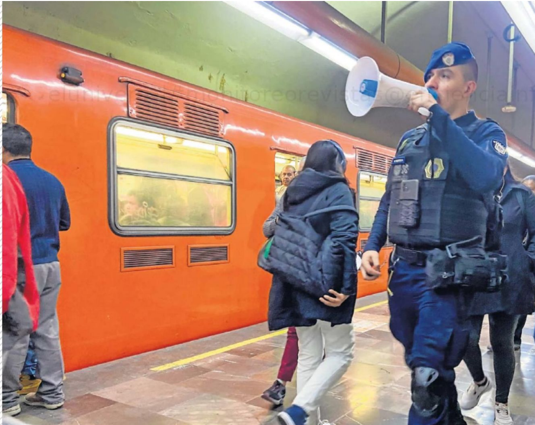
Policías indican a los usuarios las medidas de seguridad en el Sistema de Transporte Colectivo.

La seguridad en el STC se reforzó con más elementos de la Policía Auxiliar y de la Bancaria e Industrial, para sumar un total de 5 mil 800 uniformados.