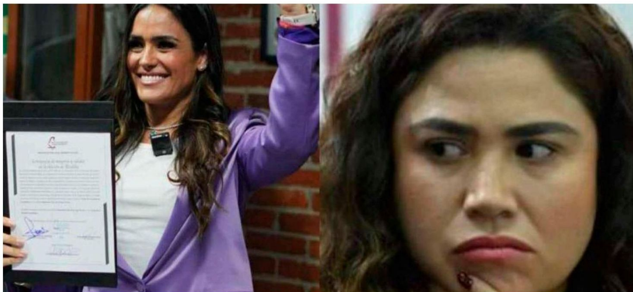
En un plazo improrrogable de 24 horas, se deben de suspender y retirar de la difusión masiva los contenidos denunciados.