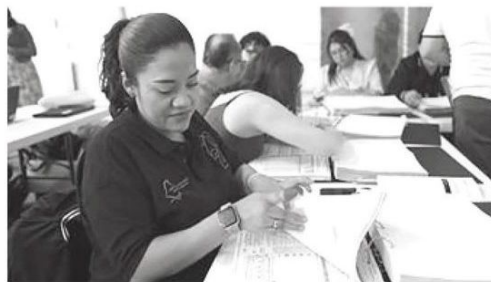
· Certeza y Legitimidad

· Demostraron una alta precisión al concluir los comicios del 2 de junio