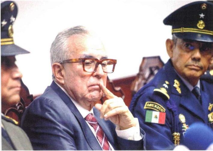
Rocha Moya. Minimizar la violencia

Durante su paso como gobernador de Tabasco, López Hernández entregó la Secretaría de Seguridad y la Policía Estatal a personajes que, según consignan documentos hackeados de la Secretaría de la Defensa Nacional (Sedena), fueron identificados como integrantes del Cártel Jalisco Nueva Generación ( Proceso digital / 5 de octubre de 2022).