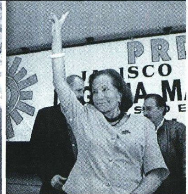
1999. Aunque fue candidata a la dirigencia del PRD, no logró conducir el partido que ayudó a fundar.