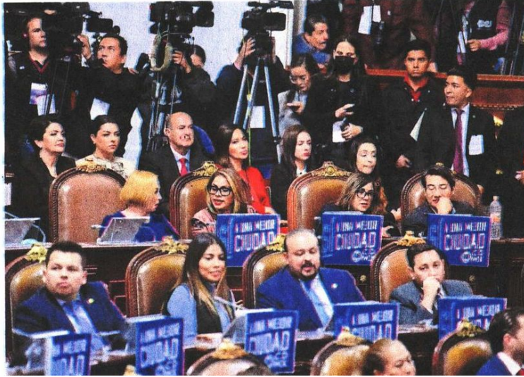
Durante la sesión solemne, legisladores del PAN mostraron en sus curules un cartel con la leyenda: "Sí a una mejor Ciudad".

La presidenta nacional de Morena, Luisa María Alcalde, y el secretario de Organización, Andrés Manuel López Beltrán, acudieron al recinto de Donceles.