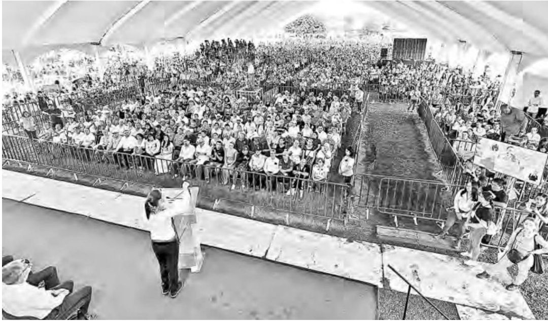
▲ “Lo importante es no olvidar quiénes somos y de dónde venimos”, dijo la presidenta Claudia Sheinbaum ante un auditorio repleto en su primera gira por Morelos.