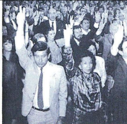
1988. El ex Presidente AMLO junto a la maestra Ifigenia previo a la fundación del PRD, un año después.