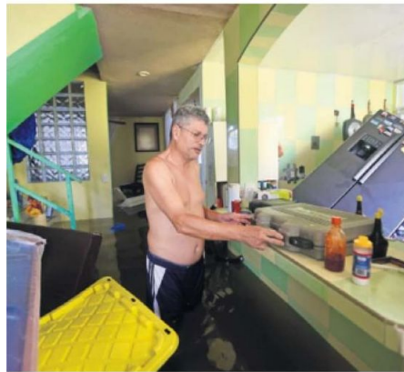
Aún conservaba nuevo, sin abrir, un refrigerador que le fue dado el año pasado tras el huracán Otis.

“Fuimos al centro comercial a comprar chalecos salvavidas, tablas para flotar. Si sigue subiendo el agua yo voy a tener que abandonar definitivamente mi casa”.