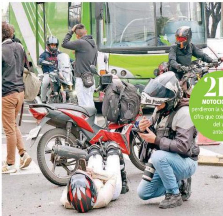
El 13 por ciento de lesionados por accidente de motocicleta presentó lesión cerebral traumática

Esta dependencia detalló que el 13 por ciento de las personas lesionadas por accidente de motocicleta presentaron lesión cerebral traumática; 10.2 por ciento llegó al nosocomio con trauma de tórax y/o abdomen; 8.3 por ciento arribó con politraumatismos; 30 por ciento presentó fractura de miembro pélvico; mientras que alrede-