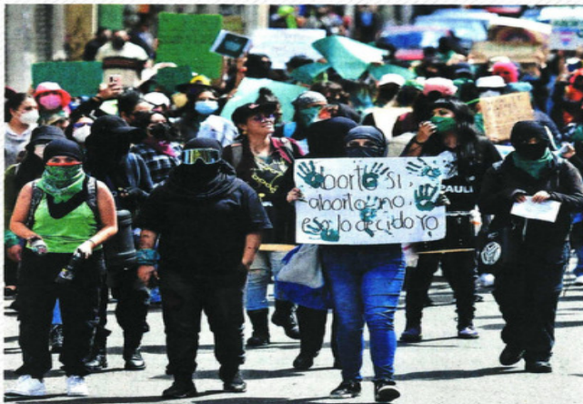
En el Estado de México, la ciudadanía mantiene la lucha por despenalizar el aborto; en los últimos cinco años, los legisladores también lo han intentado sin éxito.

"AN está en contra (...). Nuestra visión es respetar la vida desde el momento de la concepción y hasta la muerte natural"