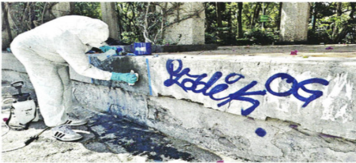
METICULOSOS. Una cuadrilla aplicaba ayer un químico removedor especializado para retirar la pintura con la que se dañó el Foro.

Los primeros minutos de luz solar se convirtieron ayer en todo un espectáculo de tonos rojizos, habituales en los amaneceres de otoño.