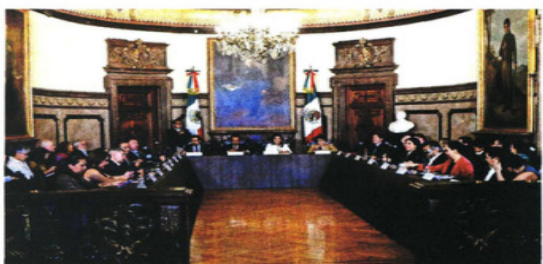
Acompañada por miembros de su gabinete, la jefa de Gobierno escuchó las primeras peticiones de los ediles referentes a abasto de agua y seguridad.

"Esta Ciudad de México es una ciudad plural y este Cabildo representa esa pluralidad (...), este Cabildo es una gran oportunidad para seguir haciendo de nuestra capital un territorio de seguridad y que sea, a la vez, un ejemplo en todas las entidades", enfatizó.