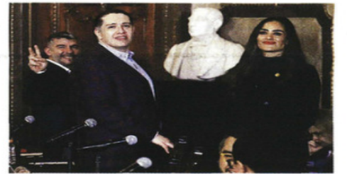
Alcaldes de Oposición y del oficialismo acudieron al encuentro en la sede de la CDMX.