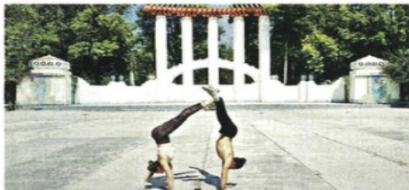
El lugar ubicado en el polígono Roma-Condesa se trata de un foro de múltiples usos para residentes y visitantes.

Roma, Condesa e Hipódromo ya han solicitado una declaratoria para proteger el parque y el Foro como espacio biocultural.