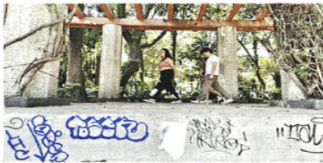
El espacio data de hace 100 años y es el primer recinto cultural al aire libre de la Ciudad.