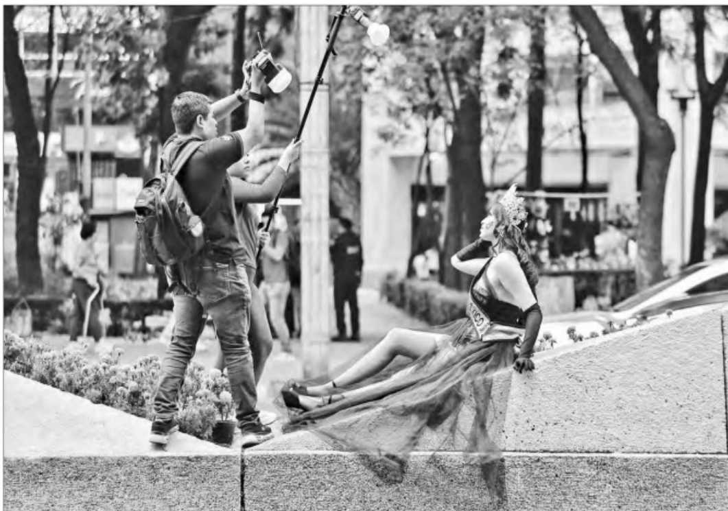
▲ La principal avenida de la ciudad sirve de fondo para hacer una buena carpeta de modelaje.