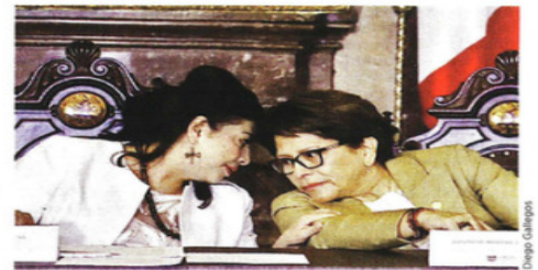
El Cabildo es un órgano mandado por la Constitución capitalina y debe ser presidido por la Jefatura de Gobierno.