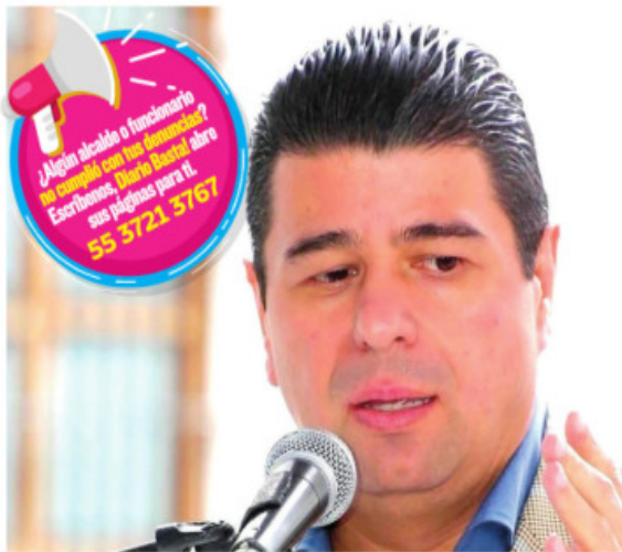
El dirigente enfrenta varios escándalos en su cargo público