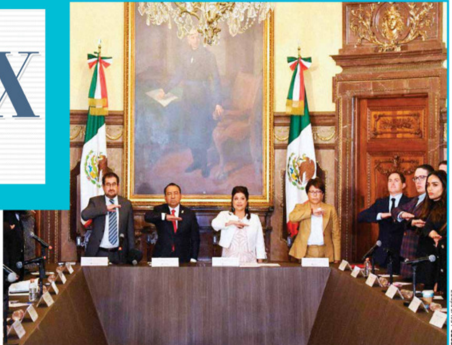
• AGENDA. La jefa de Gobierno se reunió con los 16 alcaldes en el Salón de Cabildos.

• SUPERVISION. El jueves por la noche se realizó un recorrido en el lugar.