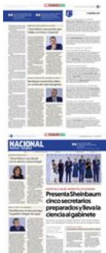
NUEVOS. Godoy, Bárcena, De la Fuente, Ebrard, Ruiz y Berdegué, ayer, con la virtual presidenta electa, Claudia Sheinbaum.