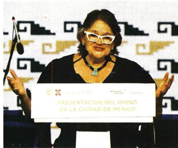
Este himno se realizó en aproximadamente tres meses, un proceso en el que participó el Colectivo Ombligo de La Luna.