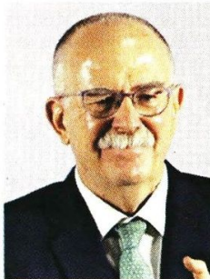
JULIO BERDEGUÉ Secretaría de Agricultura y Desarrollo Rural

Dijo que por el cambio climático, México va a tener cada vez menos agua y se re- quiere un enorme esfuerzo ante ese “gigantesco” desafío.