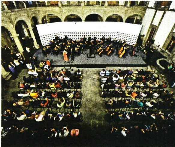
Este nuevo símbolo de la CDMX fue entonado por primera vez por la Orquesta Filarmónica local.