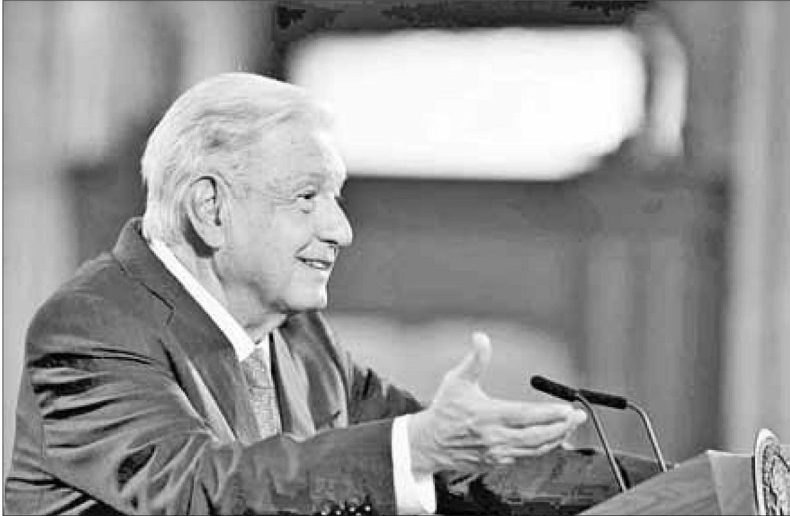
▲ Está trabajando para traer ante la justicia al juez de barandilla de Iguala que estaba en funciones la noche de la desaparición de los 43, informó ayer López Obrador.