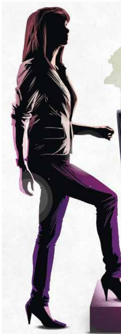
Ernestina Godoy Ramos , ocupó el cargo de fiscal general de la CDMX entre 2020 y 2024.