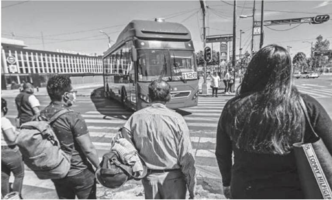
La conectividad de la zona es una ventaja para la propuesta que el ITDP ya le acercó al gobierno capitalino