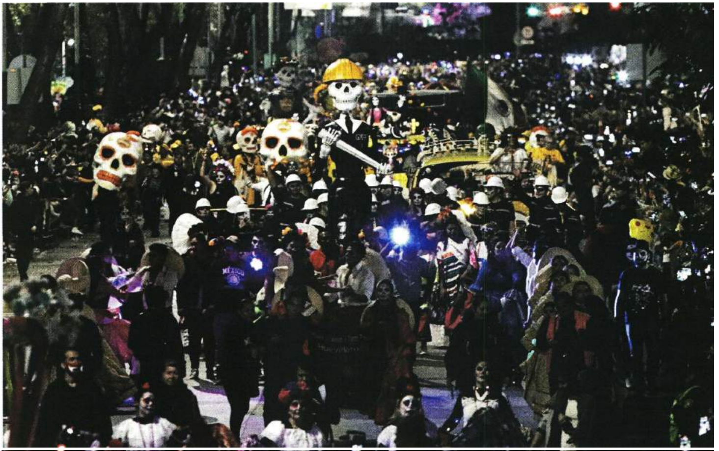
EN AUMENTO. Año con año, la participación crece. Nació en 2014 como una forma de incentivar las tradiciones propias, ante el creciente dominio de festividades extranjeras, como el Halloween.