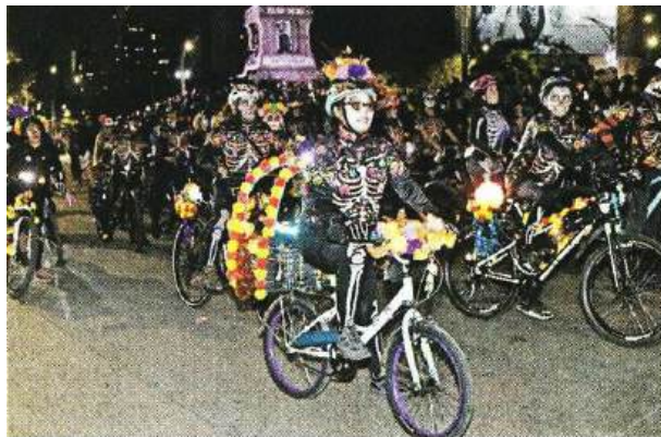
■ Algunos hicieron el recorrido en bicicleta: ¡cocatrines!