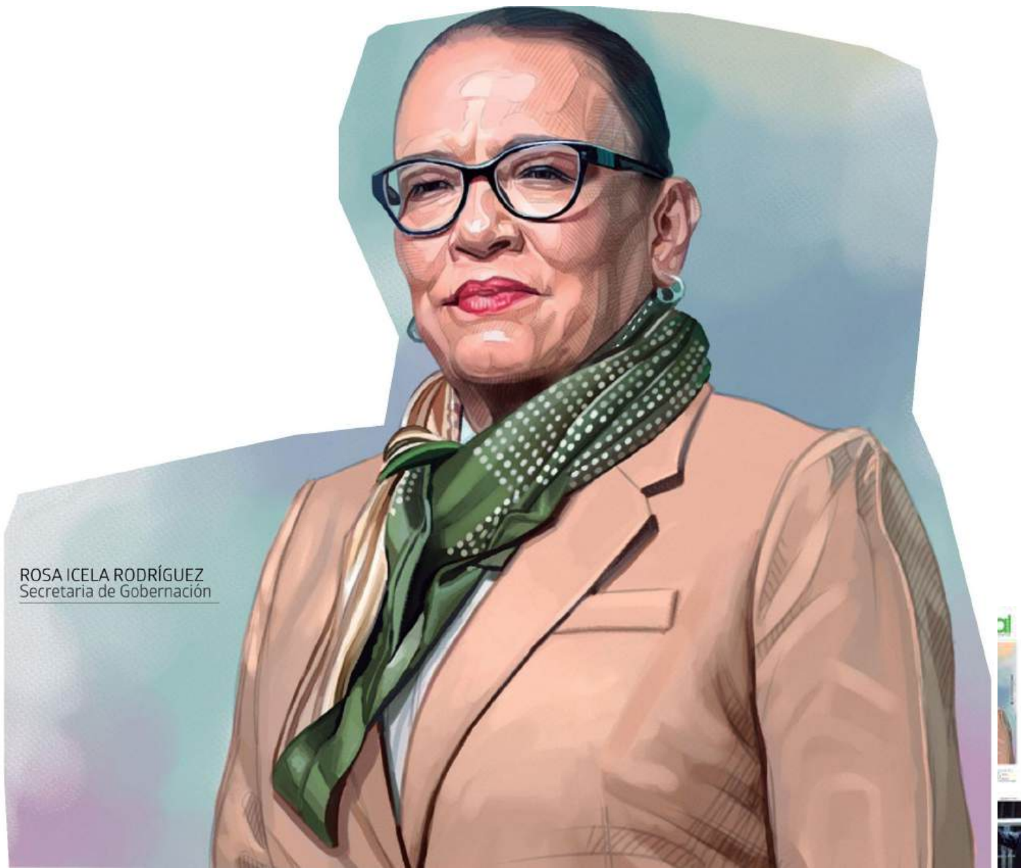
ROSA ICELA RODRÍGUEZ Secretaria de Gobernación