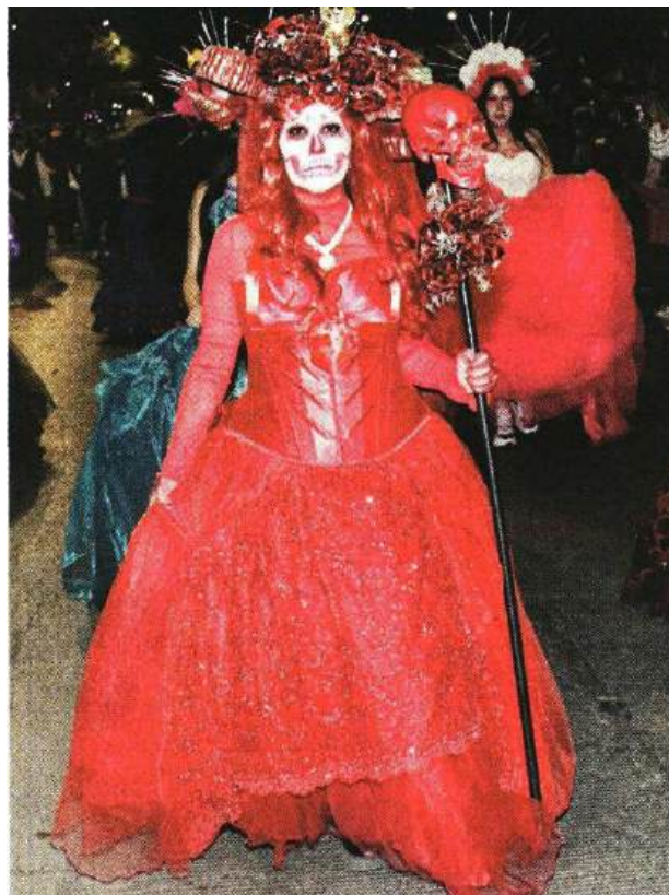
El personaje lo creó el ilustrador José Guadalupe Posada.