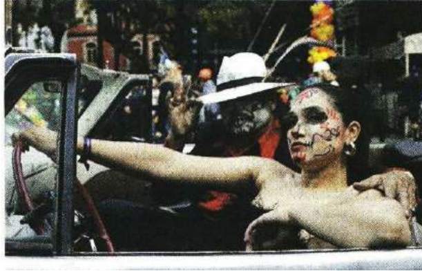
■ Catrines pachucos, obviamente, en un automóvil clásico.