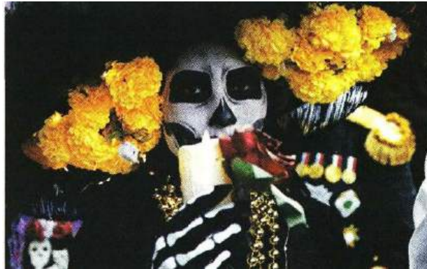
■ El empeño en las caracterizaciones se hizo notar anoche.