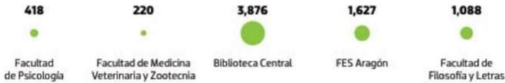
Gráfico: Rodolfo Gómez García