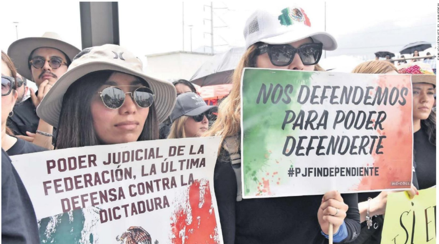
EMILIO VÁZQUEZ/EL UNIVERSAL