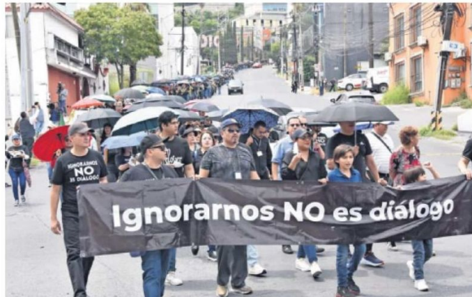
En Monterrey, Nuevo León, también se llevó a cabo una protesta y marcha de los trabajadores del Poder Judicial contra la iniciativa.

Trabajadores del Poder Judicial de la Federación de Puebla se sumaron al paro nacional contra la reforma judicial.