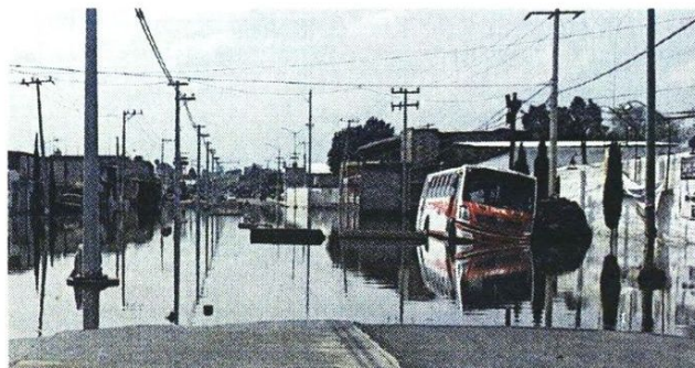
■ El chofer de un camión de transporte público intentó cruzar, pero se quedó atascado en un desnivel.