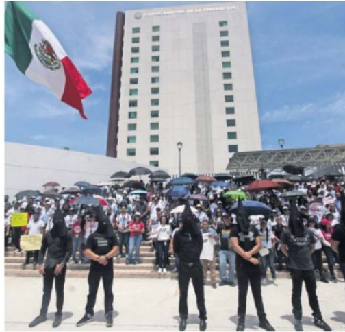
OTARIO CONTRIBUYÓ A: EL UNIVERSAL

Trabajadores del Poder Judicial de la Federación de Puebla se sumaron al paro nacional contra la reforma judicial.