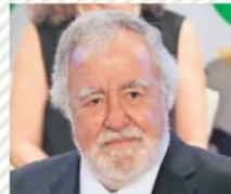
NOMBRE: Alejandro Encinas CARGO: Secretario de Planeación y Ordenamiento Territorial Es exjefe de Gobierno.