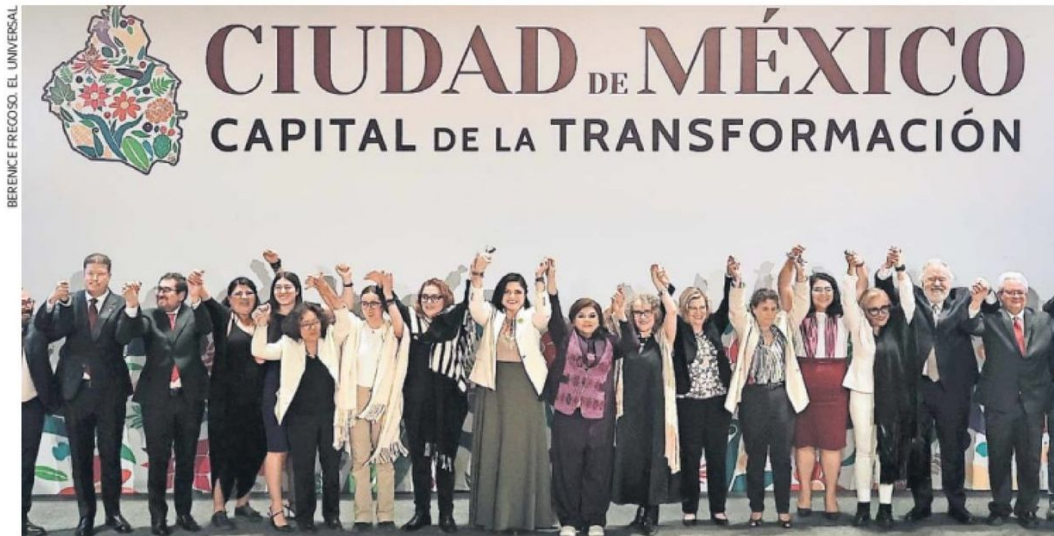
La presentación de 21 integrantes del gabinete de Brugada se realizó en el Antiguo Colegio de San Ildefonso.