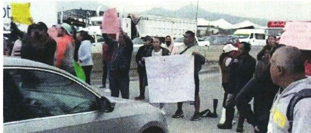
■ El bloqueo en demanda de intervención inició en un sentido de la carretera y, después, se expandió a toda.

En las calles afectadas también comenzaron a aparecer socavones y baches, producto del reblandecimiento del asfalto.