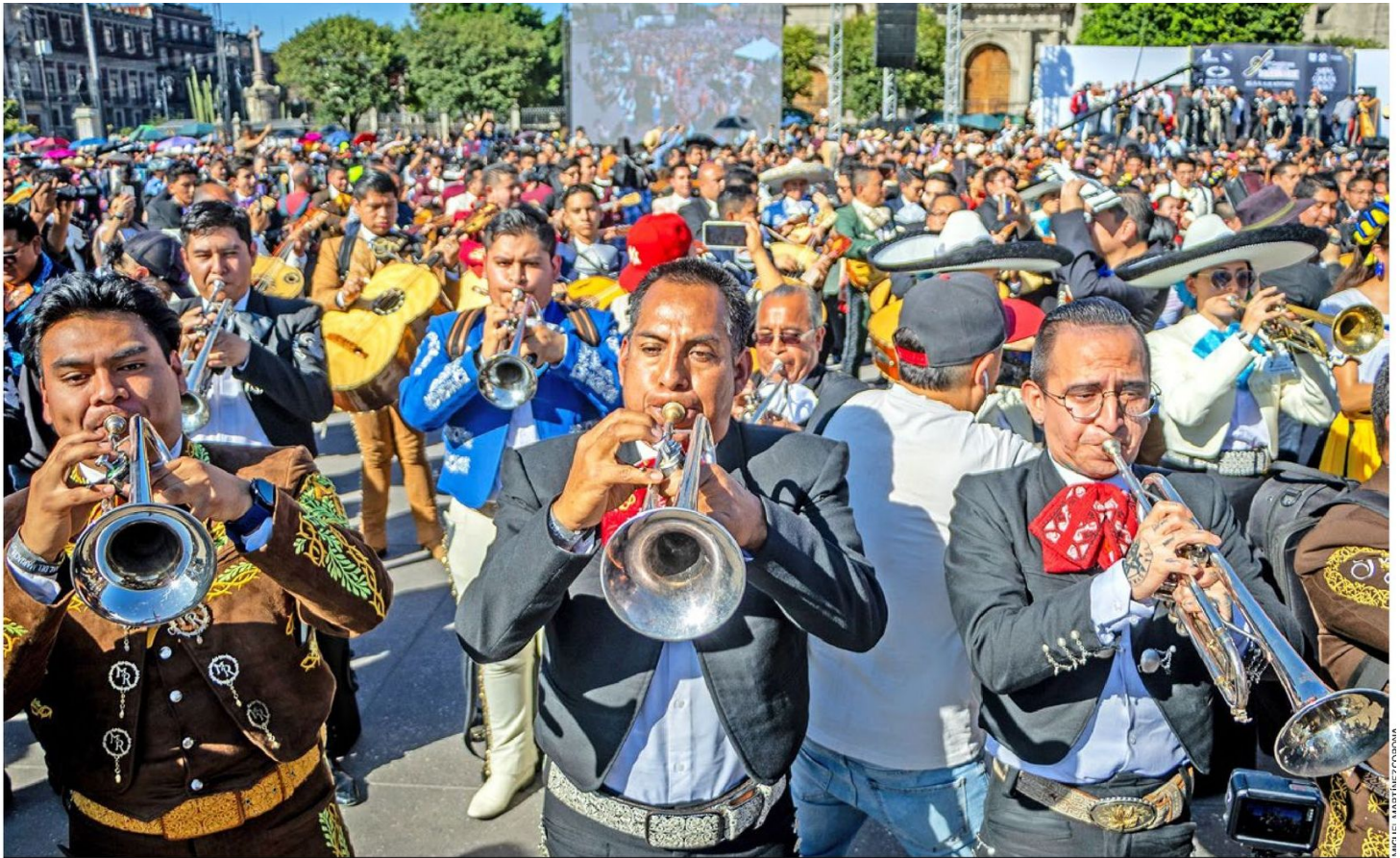
IMPONENTE. Al ritmo de Cielito Lindo , el Zócalo de la Ciudad de México fue el escenario en donde más de mil músicos rompieron un Récord Guinness, que anteriormente le perteneció a Guadalajara CDMX P.8