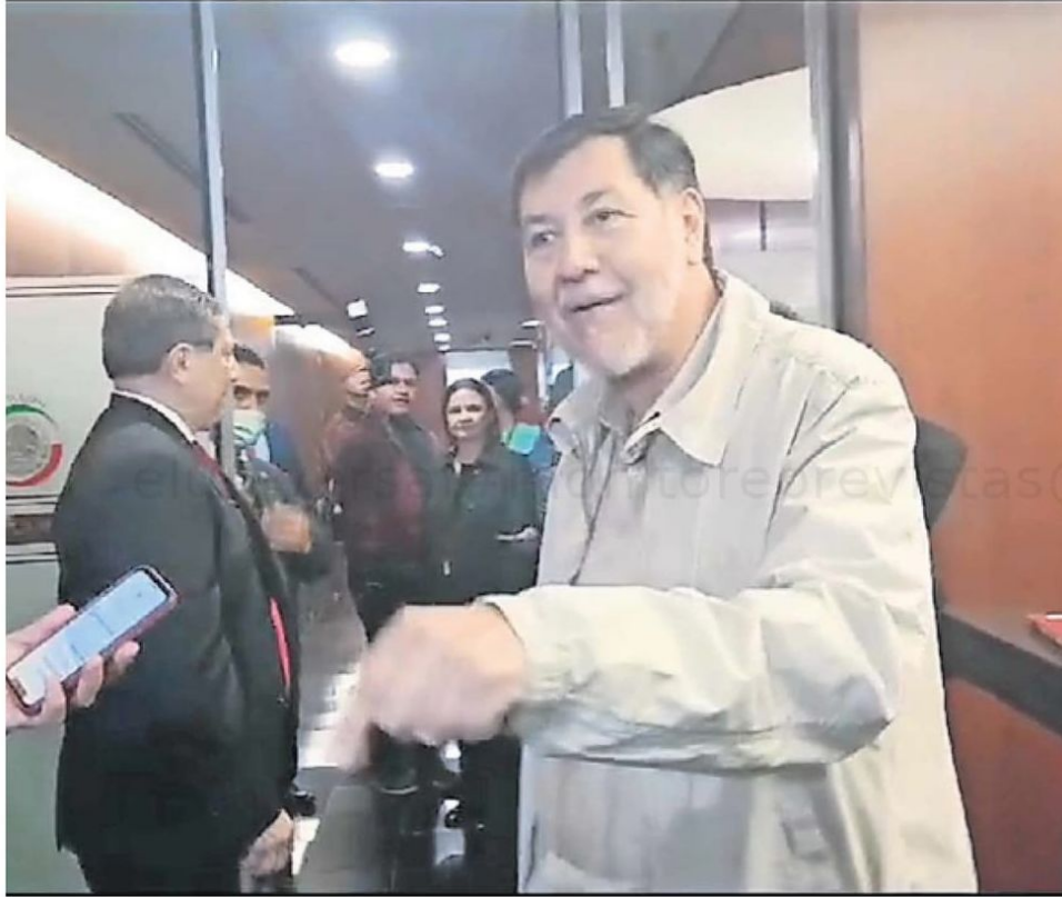
El presidente de la Mesa Directiva del Senado, Gerardo Fernández Noroña, dijo que la Suprema Corte se derrotó a sí misma por un actuar incorrecto, faccioso y sesgado.