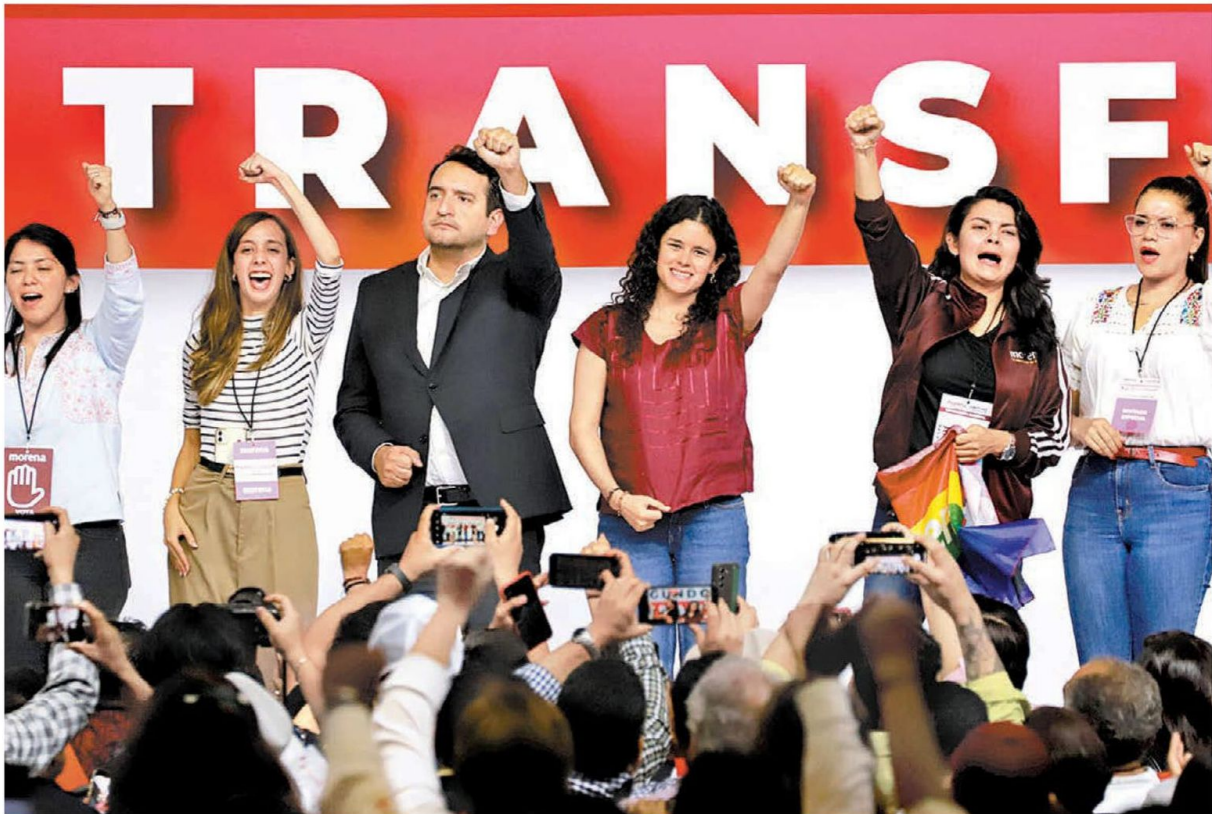
Generación de morenistas designada ayer para tomar las riendas del partido a partir de octubre.

“Nuestros adversarios se burlan de las palabras de admiración que dedicamos al Presidente; tienen razón: lo vamos a extrañar, lo que no saben es que la forma de demostrarle gratitud y cariño es siguiendo su ejemplo y cuidando su legado”, dijo la titular de Segob en un acto al que acudió también Claudia Sheinbaum. PÁGS. 6 Y 7