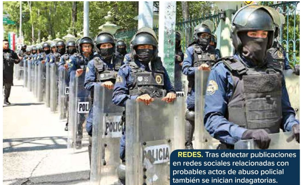
REDES. Tras detectar publicaciones en redes sociales relacionadas con probables actos de abuso policial también se inician indagatorias.