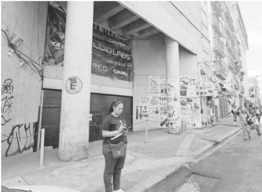
En la colonia Centro se reporta una alta incidencia de robo y homicidios