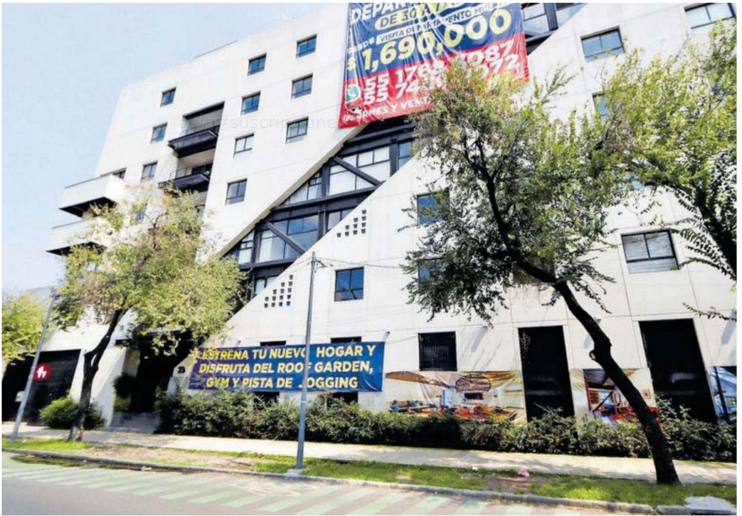
En colonias como la Morelos y Guerrero, la oferta inmobiliaria es en edificios de entre uno y cinco años de antigüedad