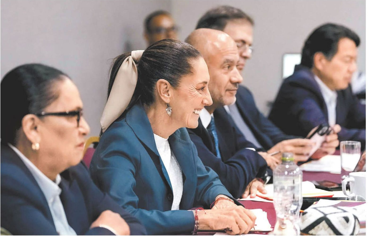
La virtual presidenta electa durante la reunión con gobernadores del sureste en el Hotel Courtyard.