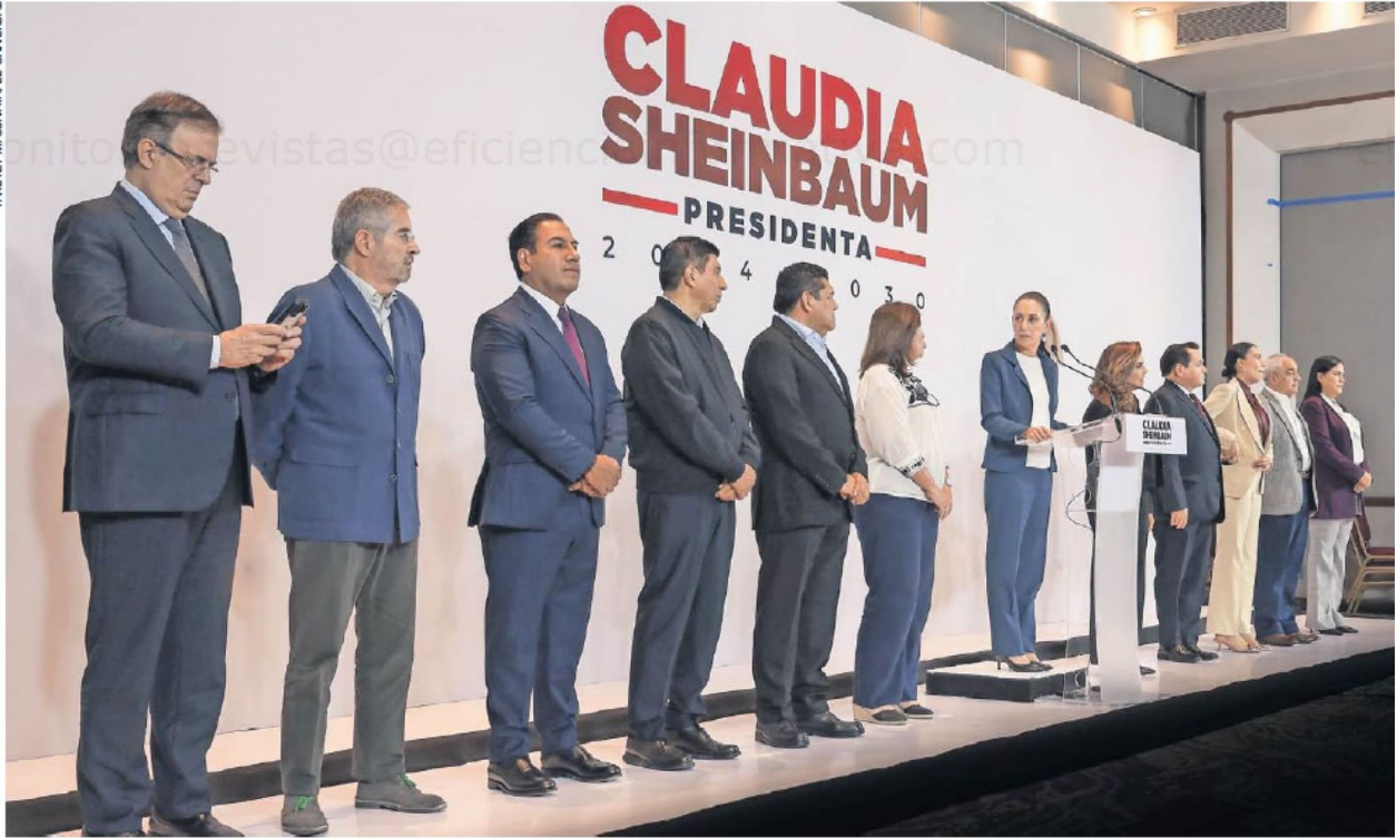
Sheinbaum encabezó, por cuarta ocasión, la conferencia con gobernadores del sureste del país y el próximo secretario de Economía, Marcelo Ebrard.