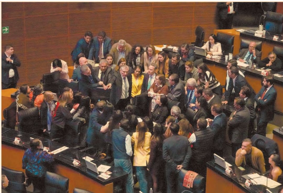
Hasta la media noche de ayer los senadores mantenían la sesión para designar a quien comandará la Comisión Nacional de Derechos Humanos.