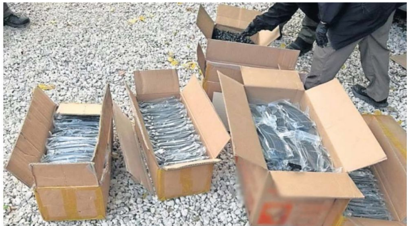
Muniones, cargadores, fusiles automáticos y vehículos han sido decomisados por las Fuerzas Armadas en la estrategia contra el crimen del actual gobierno.