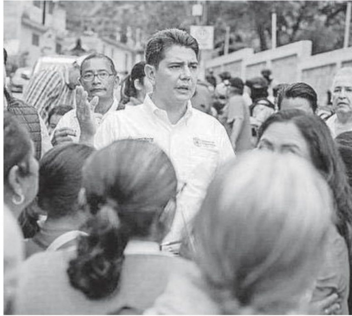
Alejandro Arcos era el presidente municipal en Chilpancingo