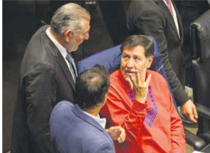
Diálogo. Adán Augusto López y Gerardo Fernández Noroña, ayer.

ADÁN AUGUSTO LÓPEZ Coordinador de Morena en el Senado