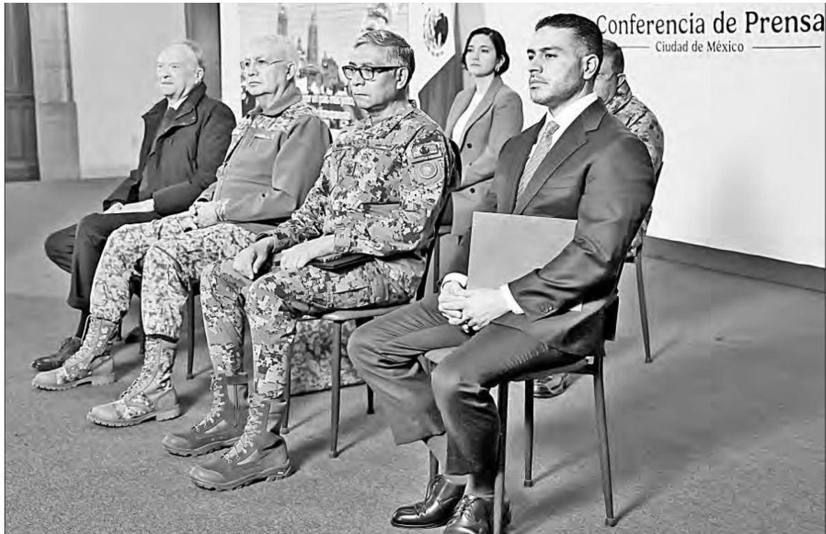
▼ El gabinete de seguridad estuvo presente ayer en la mañanera.