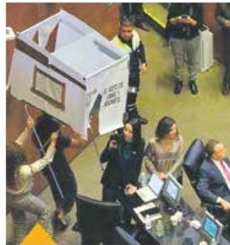
Panistas y morenistas. Jalonearon la mampara y el hecho provocó tensión.