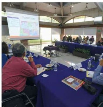
LABOR. El órgano electoral y la Sepi intercambiarán información para el desarrollo de actividades.