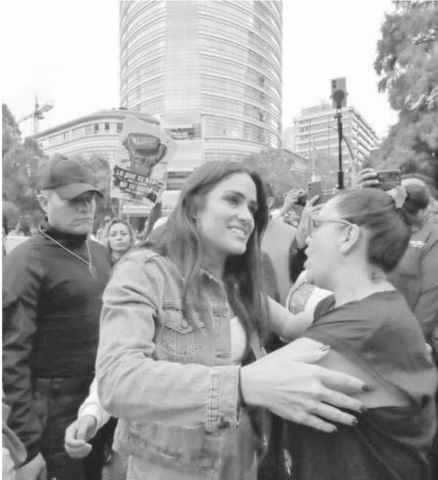
Los simpatizantes de la candidata bloquearon ayer un tramo de Reforma