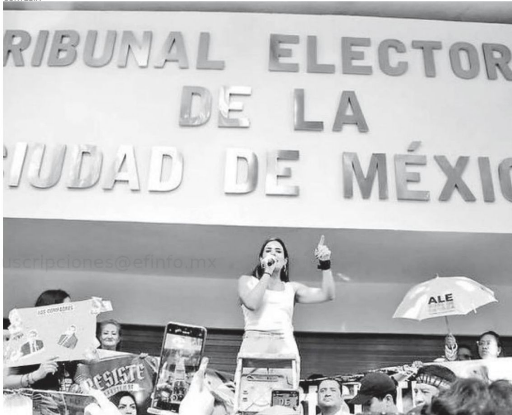
Antes de la protesta en el Tribunal Electoral de la Ciudad de México estuvo en la Diana